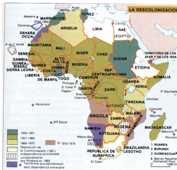
Gráfico 2. Mapa de África en 1914, posterior a la Conferencia de Berlín, y a comienzos de los años 60 con el proceso de descolonización. Con permiso de http://html.rincondelvago.com/africa_cartografia.html

La conferencia de Berlín 417 de 1884-1885 establecerá esta zona del Sudán bajo influencia (colonización) británica y egipcia. Sin embargo, hasta 1916 los tres sultanatos con soberanía sobre sus rutas comerciales del Darfur se reconocen bajo la influencia otomana.