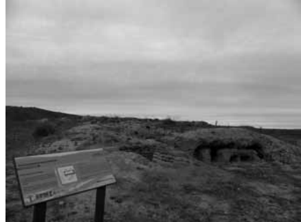
Figura 2. El mismo fortín de la imagen anterior, después de la rehabilitación.