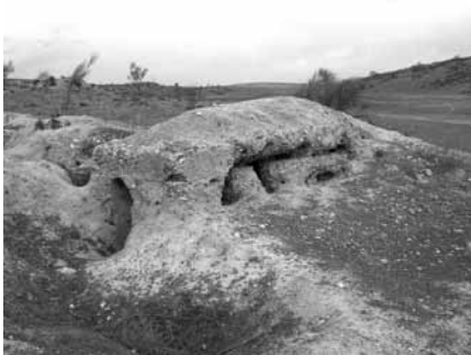
Figura 1. Fortín (puesto de escuadra) en su estado original.