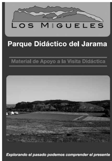
Figura 5. Portada de la unidad didáctica sobre el paraje de Los Migueles.

los mensajes que posteriormente han sido diseñados en la cartelera.