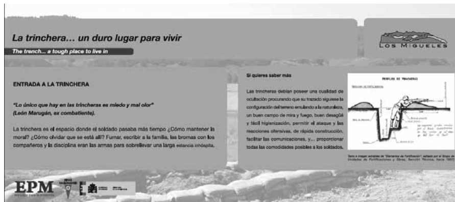
Figura 4. Cartel interpretativo en la entrada las trincheras.