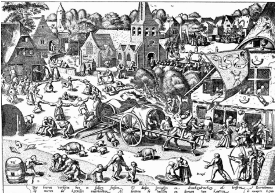
Figura 1 La Kermesse d'Hobboken de Pieter Bruegel, c. 1560

Però les invasions dels bàrbars també van afectar la continuïtat de les representacions teatrals. Els déus, els herois i els mites van ser rellevats de l'escena pels personatges de la comèdia. Al llarg de l'edat mitjana van sobreviure comèdies profanes que reflectien els costums i