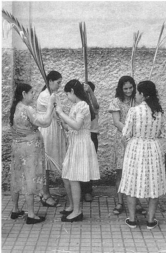
Domingo de Ramos.

En la mayoría de familias los artículos para la casa, alimentos y ropa son decisiones de las esposas; mientras que reparaciones, mejoras de la casa, libros, ahorros y comidas fuera de casa, son decisiones de los esposos. A Safilios – Rotschild 16 se le deben los términos de "orquestración de poder" e "implementación de poder". Quien tiene el poder de orquestración está en una posición que le permite decidir sobre asuntos importantes, infrecuentes, menos rutinarios y asociados con cierta flexibilidad en el uso del tiempo; además, recogen aspectos que determinan estilos de vida, rasgos y características de la familia; adicionalmente, tiene la facultad de delegar decisiones de poca monta, de donde otros derivan la sensación de estar participando con cierto poder en el proceso. En la línea de análisis de Coria 17 se puede afirmar que el poder de orquestración en las decisiones es el que deja huella, mien-