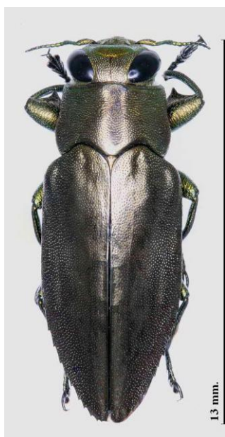
Fig. 1. Hábitus de la especie

primeros conocidos (Málaga, Valencia y Albufeira) se encuentran en o cercanos a puertos con importante tráfico comercial; los que, sin duda, han constituido la puerta de entrada en la península de la especie y desde donde se están expandiendo a otras zonas contiguas (Castellón, Murcia...).