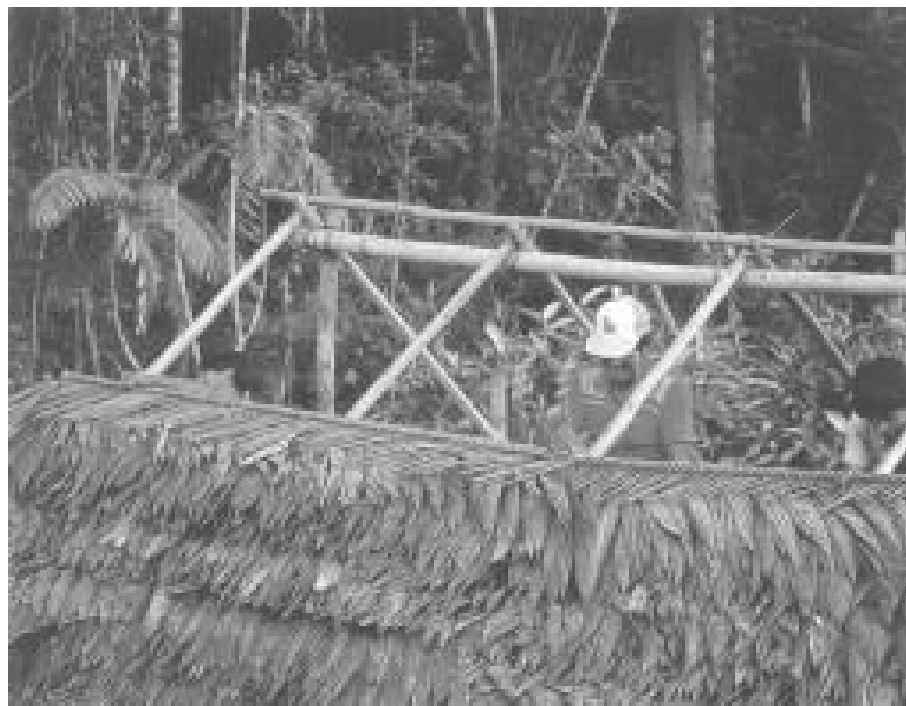
Río Cahuinarí, Amazonas, Colombia.

La antropología ha permitido describir las tradiciones “locales” (fueran