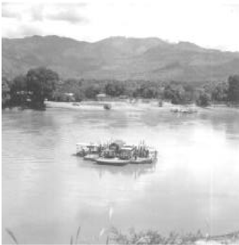
El Río Magdalena, c. 1948.

En unos pocos países, el fordismo promovió a sus obreros como consumidores y mientras se mantuvo su reclutamiento y promoción, provocó la pérdida de la identificación con