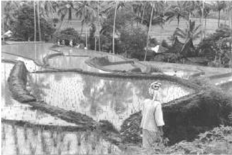
Sumatra, 1949.

La desigualdad social no impide la alianza política de estos sectores con las minorías propietarias (de la tierra, de los medios de la producción, del poder político), la Igle-