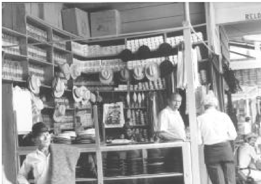
Quindío, Colombia, 1999.

La cultura es una condición de verdad cuya entidad y profundidad no es cuestionada ni puede serlo porque tiene carácter emocional y conceptual. No se trata de la “verdad” engañosa de la “máscara” correspondiente a una superestructura ideológica. La cultura es una