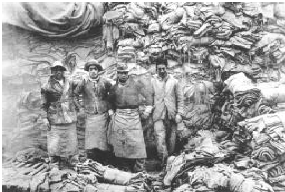
Muelle de Lejía, París.

La sociología liberal atribuye el hacinamiento, la promiscuidad, las dificultades de la existencia cotidiana en los barrios o asentamientos, al crecimiento de la población y no al sistema de propiedad de la tierra (concentrado en pocos dueños en el campo y en la ciudad), ni al sistema de empleo (que expropia el producido del trabajo a través de las interacciones políticas y culturales y de las “mediaciones” (profesionales