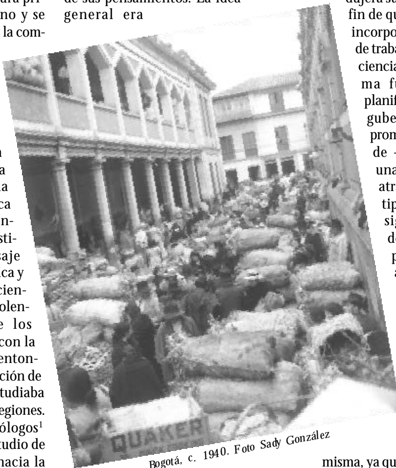
Bogotá, c. 1940.

El 80% de la población mundial era pobre (muchísimos, muy pobres) y se conocía muy poco sobre su vida cotidiana, sobre sus ciclos vitales, sobre sus costumbres y sobre el orden de sus pensamientos. La idea general era