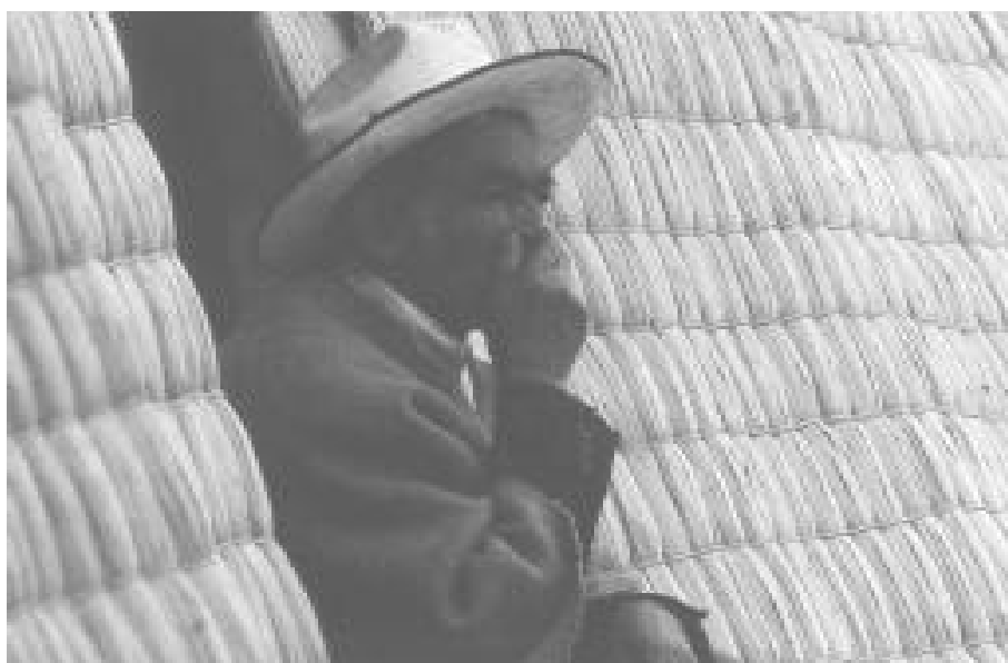
Esteras en hoja de plátano, Boyacá, Colombia.

“seguirán bajando escalones aceleradamente” y que a ellos se les sumarán nuevos pobres, no solamente se puede tomar nota de los efectos del modelo económico neoliberal (que se nutre de la expulsión de trabajadores cambiándolos por tecnología) sino también del alto costo que el sistema está dispuesto a pagar por la gobernabilidad de ese conjunto humano marginal. Los pobres y los marginales -como el resto de la sociedad- se constituyen como tales en y por la relación con un espacio social que puede caracterizarse por la posición relativa con respecto a otros lugares