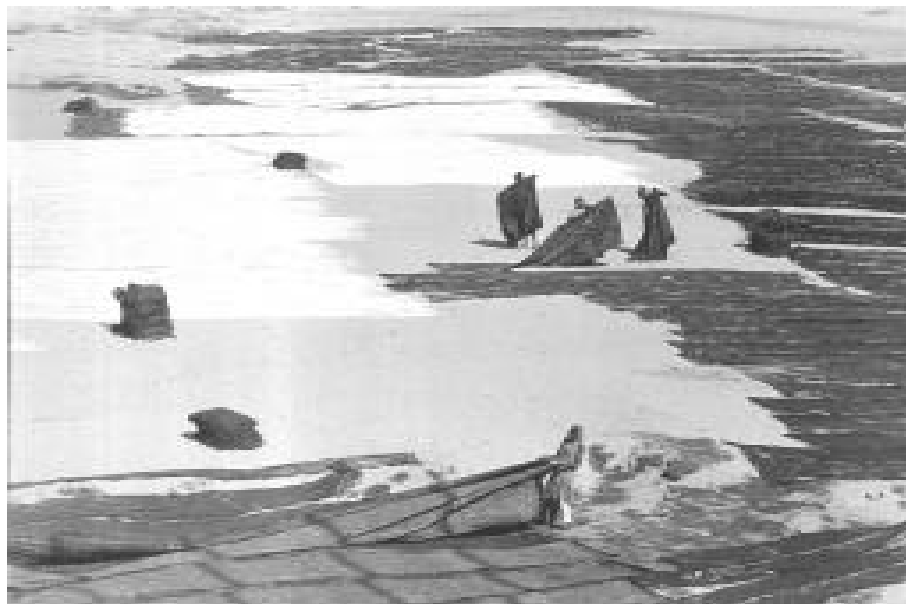
Ahmedabad, India, 1966.

gería que se trataba de una cultura menor y, además, podía concluirse que los pobres estaban atrapados en una configuración de costumbres e instituciones que los inmovilizaba históricamente, haciendo muy difícil la tarea del “desarrollo de la comunidad” en dirección al progreso social. La cultura de la pobreza ponía serios obstáculos al desarrollismo (cuando los libros comenzaron a difundirse en los medios académicos, Estados Unidos empezaba a poner en práctica el plan continental llamado Alianza para el Progreso ). Este culturalismo “aplicado” se inspiraba en la doctrina denominada “indigenismo” mexicano, se ponía en acción en los Institutos Indigenistas de cada país y se coordinaba a través del Instituto Indigenista Americano con sede en México y con fuerte apoyo de la OEA. Una ruptura radical con él tuvo lugar al celebrarse el Simposio de Barbados en 1970 (Grinberg, 1972), aún cuando los principios básicos del indigenismo siguieron usándose e inspiraron los textos de reclamo de las asociaciones indígenas en los distintos países. Dicha reunión -que trató la situación