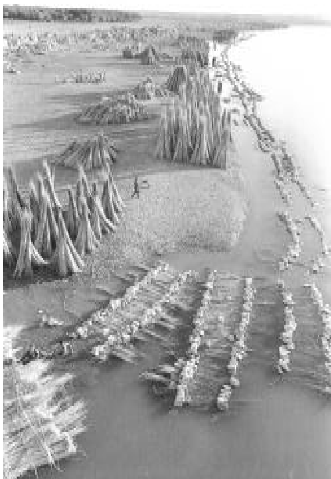
L'Euphrate, Iraq, 1965.

sexo, clasificación laboral y cultura de pertenencia, y que la naturaleza de la trama es similar a los efectos mecánicos de una piedra cayendo al agua, donde los círculos concéntricos se acercan o se alejan