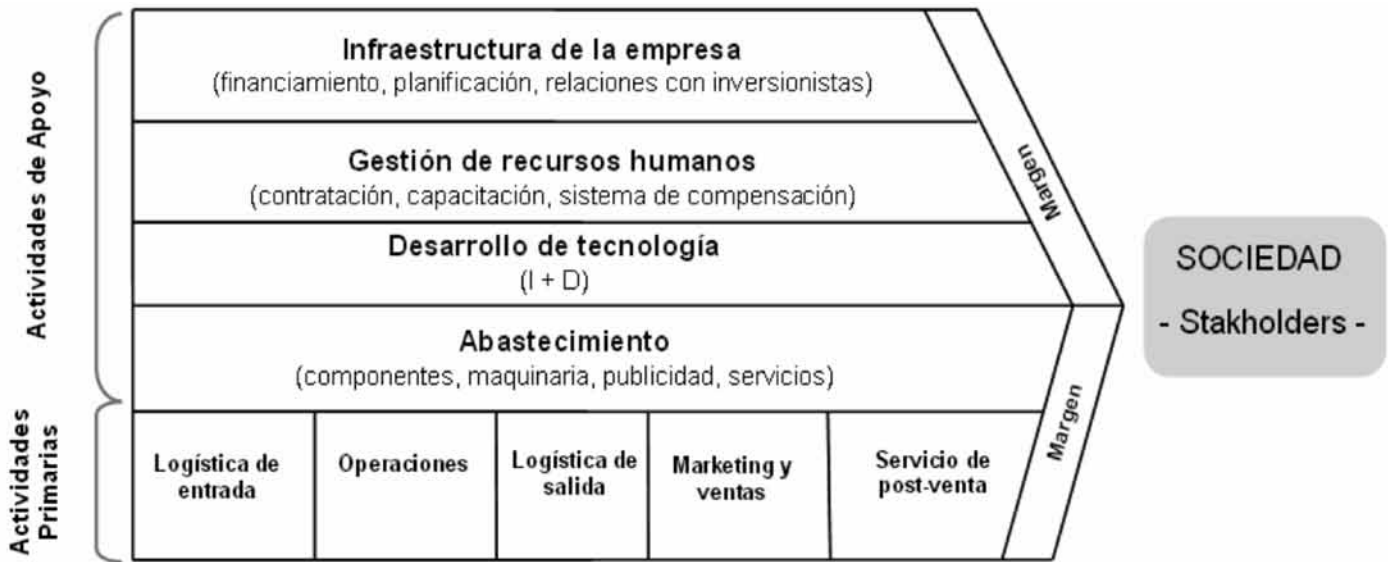
Gráfica No. 1. Modelo de la Cadena de Valor

Fuente: Adaptación de Porter, M. & Kramer, M. (2006); “Strategy and Society”.