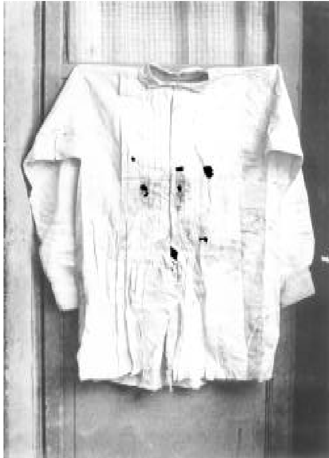
La camisa del Emperador Maximiliano después de su ejecución, México, 1868. Francois Aubert

En este camino la negociación construye sus propios procesos de regulación social del conflicto, según el nivel de éste, las personas implicadas, o el tipo de conflicto; pero ante todo, estructura una dinámica para trabajarlo a cualquier nivel como un proceso pedagógico.