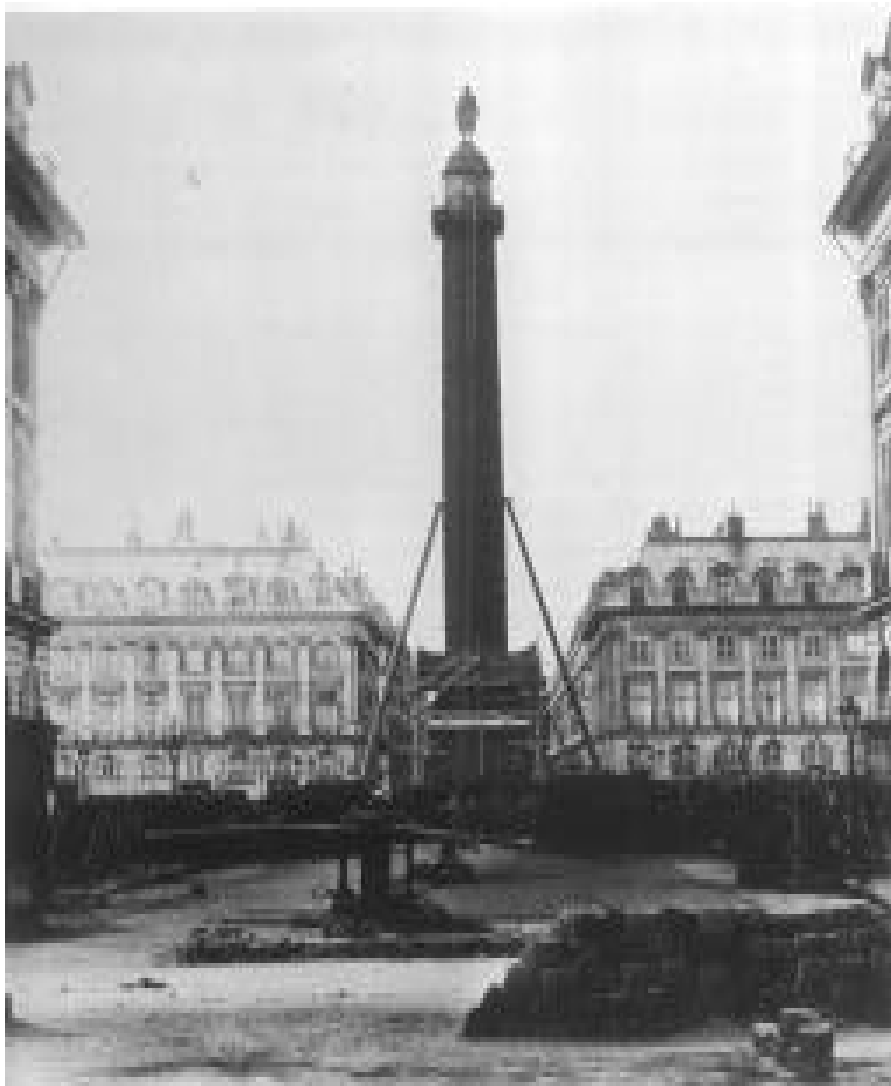
Columna Vendôme, antes de ser demolida, 1871

8. El ascenso social y cultural como meta de vida. Una idea del desarrollo y el subdesarrollo fundamentado en la posesión de bienes materiales nos ha llevado a ansiar tener siempre más de lo que se tiene y llegar a los niveles de quienes sentimos “están por encima de nosotros”, produciéndose una distorsión del sentido de la vida, a la vez que invisibiliza a quienes están “por debajo de nosotros”. Pero si todos alcanzamos el ascenso social, si logramos el “ideal” de vivir y tener los niveles de vida de los países del norte, el planeta colapsaría como consecuencia de seguir este modelo de desarrollo no sustentable.