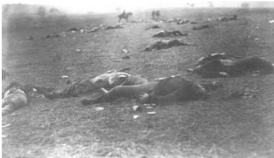
“Cosecha de muerte”. Guerra de Secesión, USA, 1863. Timothy O’ Sullivan

Se busca aprender a tratar y resolver los conflictos, a través de su visibilización mediante mecanismos