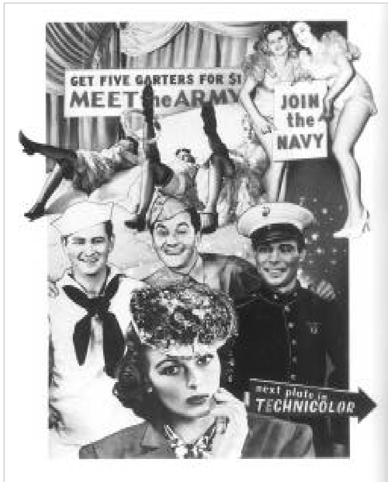
“Esta maravillosa guerra...”

Desde el multiculturalismo crítico, la interculturalidad no es vista como el simple encuentro de culturas, sino como el encuentro que enriquece, reconociéndole los sustratos de poder, a la idea multicultural y por ello está en condiciones de producir una negociación cultural real, es decir, empoderamiento en y desde las culturas.