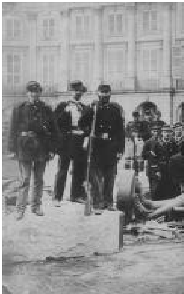
“La Comuna de París considera que la columna imperial símbolo de la fuerza y la falsa gloria, una afirmación del

El conflicto nos recuerda que somos seres en permanente lucha contra adversarios internos, externos, y en ocasiones virtuales, a los cuales hemos constituido para enfrentar la dureza de nuestra condición, es decir, de esta manera vamos adquiriendo la certeza de que ser humano es fundamentalmente conocer el conflicto.