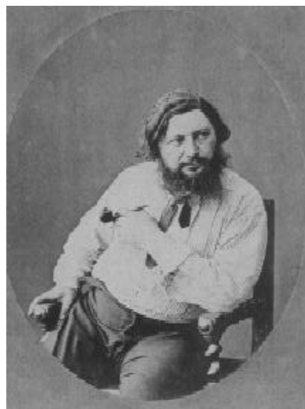
El pintor Courbet, arrestado por la demolición de la columna Vendôme. La Comuna de París. Nadar

No va a ser posible instaurar procesos de cambio mientras no deconstruyamos la presencia patriarcal en nuestra subjetividad, en las prácticas sociales, y en