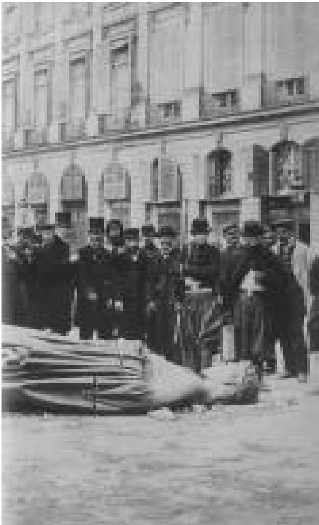
de la Place Vendôme es un monumento a la barbarie, militarismo, un insulto a la fraternidad... ”.

Una vez que conocemos la experiencia del conflicto nos queda la certeza de que siempre está ahí, agazapado para presentarse a la menor oportunidad. Parece que hubiéramos nacido para él y es allí donde reconocemos la raíz del conflicto: en los más variados escenarios de mi ser en el mundo y que reconozco también como los niveles en donde es construida y manifiesta mi ¿individuación-socialización: