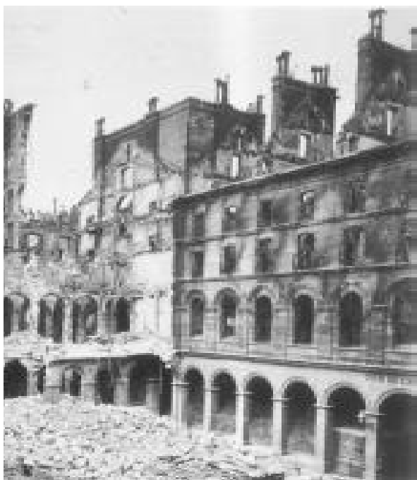
incendiado durante La Comuna por E. Appert.

En ese sentido, podemos afirmar que el conflicto es un sistema complejo que debe aprender a descubrirse. No es el impase que emerge en nuestra vida como problema, tampoco es el simple suceso a través del cual se manifiestan: el miedo, la desconfianza, la enemistad, o el odio: éstos son elementos que lo alimentan y hacen parte de su dinámica, pero no son el conflicto mismo, ya que estas manifestaciones son simplemente la muestra de que él está escapando por nuestras grietas.