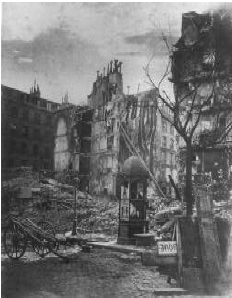
Fin de La Comuna, 1871

truye para reconocer que la diferencia es real. Igualmente, significa que debemos confrontarnos, enfrentarnos cara a cara con aquello que nos molesta, exigiéndonos salir de la cultura social de la hipocresía para reconocer los múltiples caminos de diferencia y exclusión frente a los