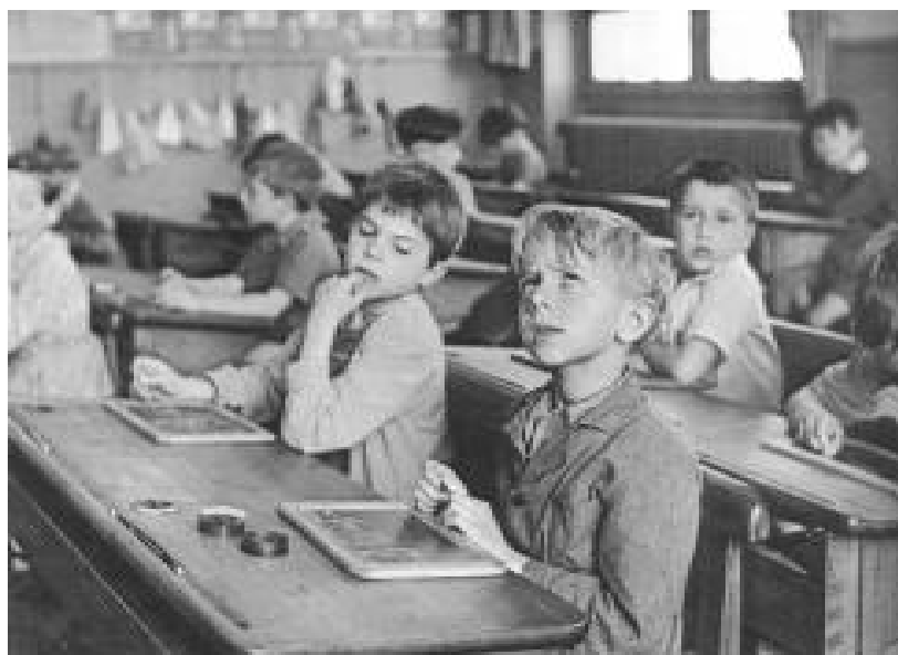
1950, Robert Doisneau

herente a las sociedades y a las instituciones sino que además “se configura como un elemento necesario para el cambio social” (Jares, 1997). Así mismo, lo contempla como un escenario para la creatividad y la recreación conjunta y dialógica de las sociedades o los grupos en conflicto. En este sentido, en el terreno educativo, se lo considera como “un instrumento esencial para la transformación de las estructuras educativas” (Jares, 1997) y el “cuerpo/sujeto no es sencillamente el producto de una homogénea totalidad de discursos sino antes bien un terreno de lucha, de conflicto, de contradicciones” (Maclaren, 1994) 1 .