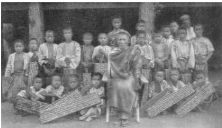
Jóvenes birmanos con su maestro budista. 1943. Mrs. Doveton

En lo que sigue, trataremos de mostrar esta heterogeneidad, no sin antes hacer un breve recorrido por algunos enfoques y hacer ciertas anotaciones sobre lo que consideramos es un acercamiento inicial al conflicto desde la comunicación-educación, todo lo cual nos servirá de marco para entender mejor el lugar desde donde se expresan los actores escolares.