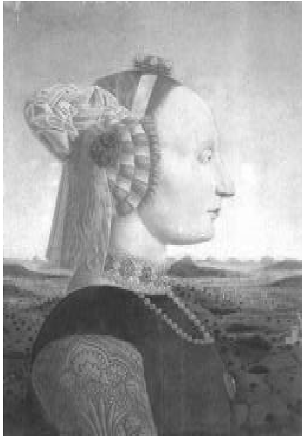
“Federico da Montefeltre y su esposa Battista Sforza” . . .