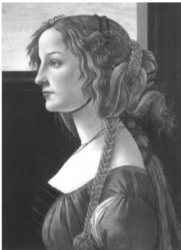
Sandro Botticelli, h. 1480, Berlin

cual se conforman las subjetividades de los y las jóvenes padres y madres; relaciones que reguladas por el poder y la ubicación en el sistema de producción inciden en la conformación de lo singular, lo particular, los afectos, símbolos y pasiones que regulan los cuerpos sexuados, generizados y reproductivos. Lo anterior nos permitió observar que no sólo las subje-