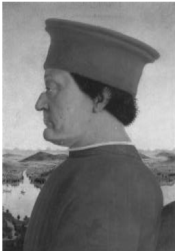
. . . Diptico de Piero della Francesca, s.f., Florencia, Los Uffizi

ciales y culturales –por efecto del sistema educativo y la estructura de clases– marca los planes de vida que unos y otros jóvenes se trazan y son determinantes al momento de tomar decisiones vitales como una profesión, la formación de familia o la adquisición de ciertos bienes materiales.