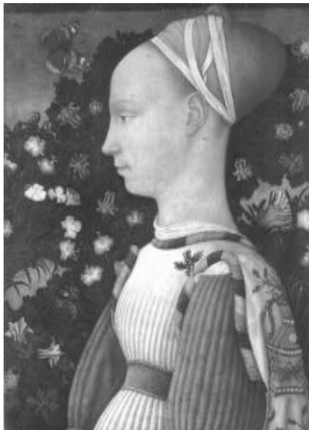
“Retrato de muchacha”, Pisanello, h. 1433, París, El Louvre

juventud como si ésta fuera un hecho dado que cada cultura define a su modo, pero que finalmente se da en todo lado; a mi modo de ver, entiendo por construcción de la juventud un cuestionamiento de la idea misma de “juventud” mediante la determinación del conjunto de discursos que forman la juventud como