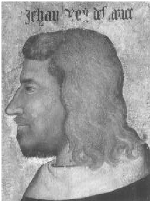
“Juan el Bueno”, anónimo, h. 1360. París, El Louvre

sus respectivas ideas de lo adecuado a cada momento vital–, aprisiona al sujeto en un ordenamiento temporal que lo mantiene en un “estar siendo pero aún no ser” (Lesko, 2001). Así, la juventud, como discurso social, resulta siendo una categoría de poder y control del mundo adulto expresada en un modo de ordenamiento