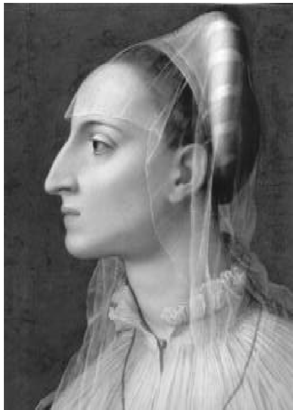
“Laura Battiferri”, Agnolo Bronzino, h. 1555, Florencia, Palazzo Vecchio