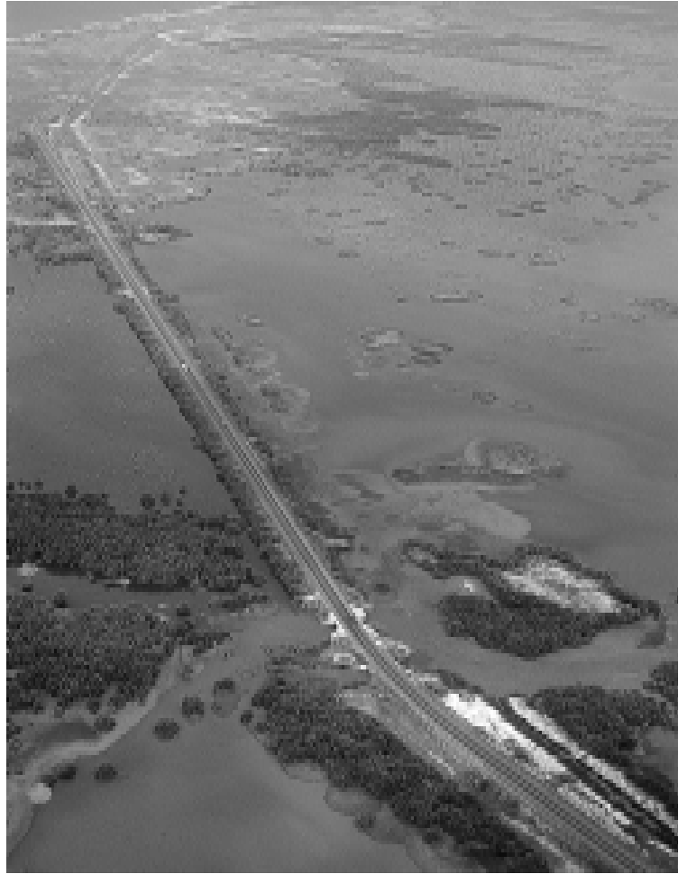
Carretera que interrumpe el intercambio de aguas entre el mar y la laguna. Lagos y lagunas de Colombia. Edición Banco de Occidente S.A.

cado” nutricional o social. Tal hallazgo es muy revelador de la fuerza que adquieren ciertas representaciones y prácticas sociales a pesar de su carácter reciente. En la actualidad, en diversos grupos poblacionales el consumo de carne es asociado a estatus, a comida de un grupo privilegiado. Sin embargo, hace apenas medio siglo no había en torno a esta práctica un discurso articulado que lo convirtiera en indicio de diferenciación social. A pesar de la ausencia de un discurso sistemático sobre el asunto, se han identificado distintas coyunturas históricas y modalidades de consumo de carne anteriores a la mitad