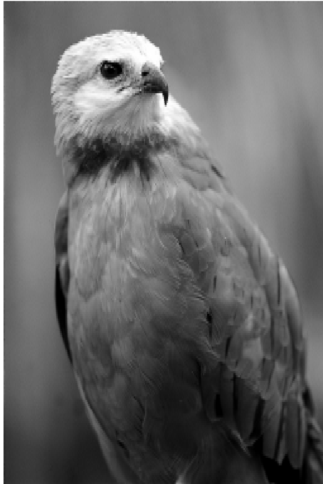
Águila de las lagunas caribeñas. Lagos y lagunas de Colombia. Edición Banco de Occidente S.A.

Ciertamente, cuando la historia agraria y los relatos de los ganade-