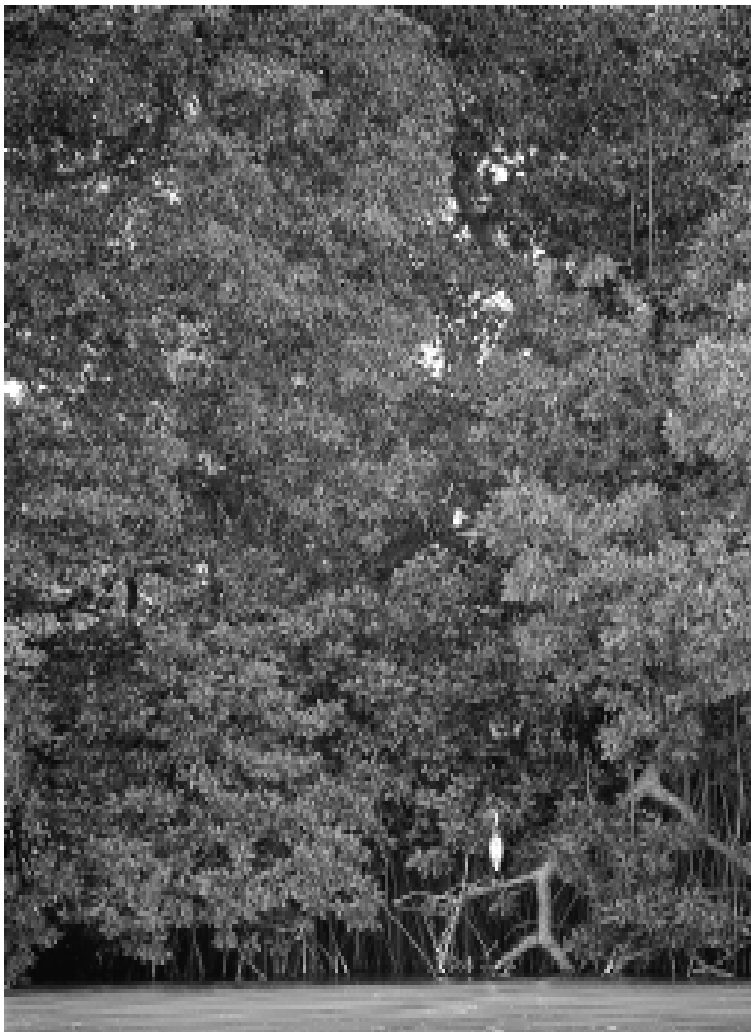
Los bosques ribereños, fundamentales para controlar la erosión. Lagos y lagunas de Colombia. Edición Banco de Occidente S.A.

Pese al auge de la demanda urbana, aprovechada especialmente por los empresarios antioqueños que explotaban las sabanas del Sinú, los ganaderos de las zonas más