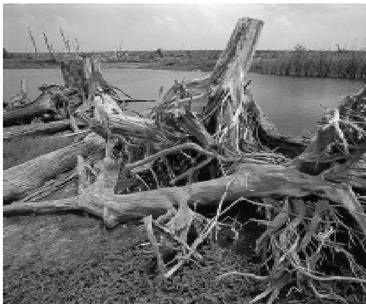
“Salinización de las aguas del ecosistema lagunar costero y muerte del bosque”. Lagos y lagunas de Colombia. Edición Banco de Occidente S.A.

lencia, en lo que algunos autores llaman una política sexual de la carne (Adams, 1990). A menudo la carne se asocia con los hombres, los vegetales y otras comidas no carnívoras son vistas como comida de mujeres, lo cual, además las hace indeseables para los hombres. En efecto, las mujeres y los grupos subordinados, considerados grupos de segunda clase, se asocian con comida de segunda clase en culturas patriarcales: vegetales, frutas y granos antes que carne (Adams, 1990: