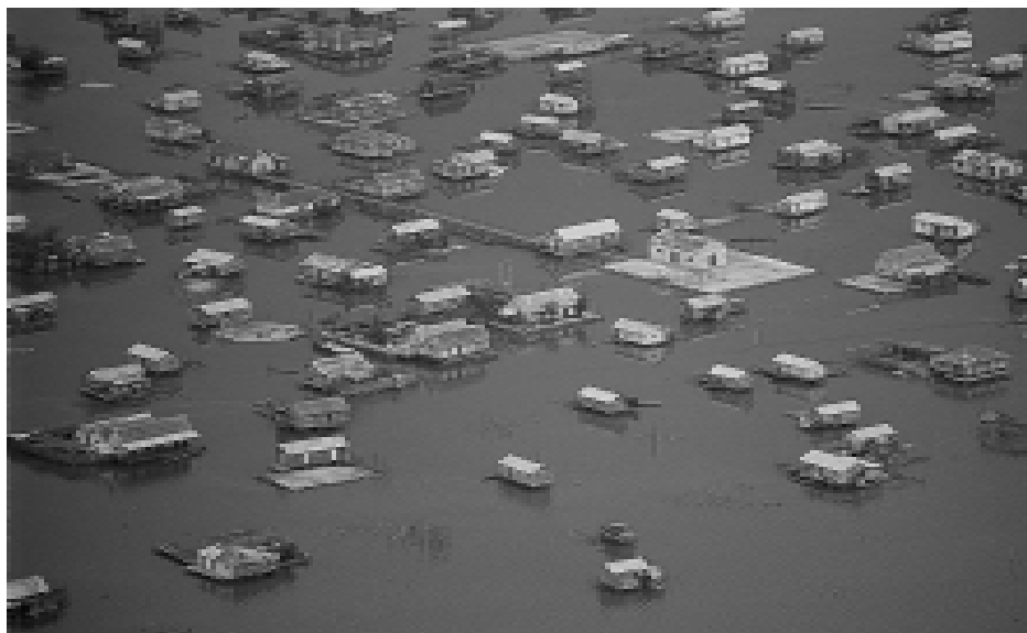
Pueblo de pescadores de agua dulce en el Caribe. Lagos y lagunas de Colombia. Edición Banco de Occidente S.A.

A partir de los procesos de ocupación por demarcación de territorios ganaderos, proceso que se intensificó solamente entrado el siglo XIX con la aparición de las cercas permanentes (Patiño, 1985: 316), los ganados fueron especialmente utilizados para lograr ganancias directas, sin mayor inversión de capital. Otro autor explica “que los abundantes pastos... eran el sustento de los animales que al reproducirse aumentaban el patrimonio de sus propietarios” (Rojas de Perdomo, 1993: 119); patrimonio que, ayer como hoy, está relacionado con el prestigio, del cual la actividad ganadera es un importante indicador (Parsons, 1993: 38). Los usos del ganado que se empezaron a generar con este crecimiento casi vegetativo de las manadas fueron diversos. Conta-