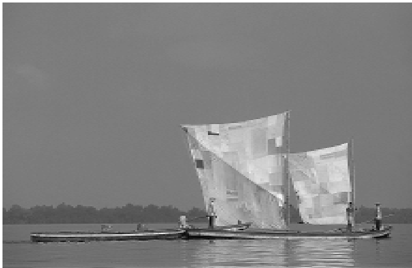
Pesca en las lagunas costeras del Caribe, “respetando su conservación”. Lagos y lagunas de Colombia. Edición Banco de Occidente S.A.

No obstante, el crecimiento de las ganaderías y su influencia en el desarrollo político y económico del país sólo se impuso de manera definitiva durante la fase inicial de la modernización en la primera mitad del siglo XX. En efecto, es en este período cuando el Estado centralista comenzó a fortalecerse y los ganados –siguiendo el liderazgo de la economía cafetera y su impacto