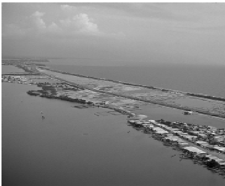
Carretera de La Cordialidad, que hizo colapsar el ecosistema. Lagos y lagunas de Colombia. Edición Banco de Occidente S.A.

dientes. Se requería la presencia de nuevos avances tecnológicos en la preservación casera e industrial de alimentos y la adopción más intensa de modelos civilizatorios europeos por parte de las clases urbanas dominantes, para proyectar de manera definitiva el predominio del consumo de carne 6 . La adopción de electrodomésticos que permitían la conservación de la carne y la emergencia de culturas urbanas orientadas por una creciente oferta y publicidad de los ganaderos más