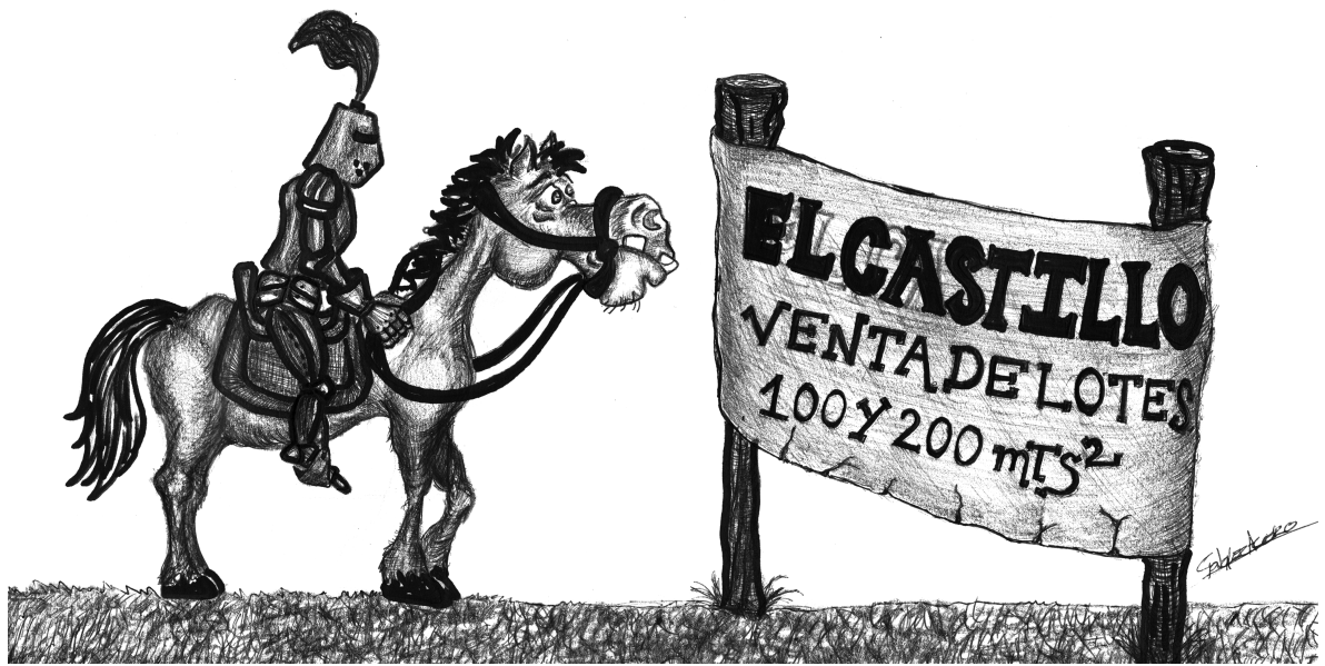
Feudalismo. Caricatura Francisco González Acero, 2011.

la burguesía mercantil actuaba como mediadora entre dos lógicas: la de los mercaderes y la de los consumidores y productores. De esa situación los comerciantes obtenían ventajas, gracias a la diferencia de precios entre compras y ventas, así renunciaban a la inversión productiva. En efecto, el gasto suntuario era improductivo. En el caso castellano, era notable la importación de textiles de altos precios. Las telas eran bienes de prestigio cuya clientela era la aristocracia feudal. El beneficiario de este valor de cambio era el mercader en una relación asimétrica entre compra y venta. Y era asimétrica por ser un comercio de “no equivalentes” (203). Los señores buscaban un valor de uso que contribuyera a reproducir su prestigio y con ello su dominio político. Los comerciantes, en cambio, pretendían maximizar su ingreso monetario. Pero no se trataba aún de la hegemonía del capital mercantil, porque no llegó a dominar la producción social; se limitó a quedarse con parte de la renta feudal. Y con ello a reproducir las relaciones feudales dominantes.