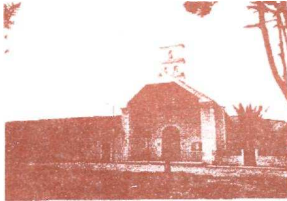
Capilla Doctrinera. Tabio. Cundinamarca