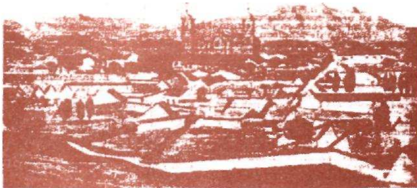
Vista de la ciudad de Zipaquirá. curas como a hacendados obtener beneficios durante el periodo colonial.

Los conventos se establecieron principalmente en las ciudades y en algunas de las villas del siglo XVII y XVIII, porque su presencia en el espacio urbano estaba muy relacionado con la importancia real esperada en el núcleo urbano. En Mariquita se instalan 3 conventos, en Honda 4, etc.- en los pueblos de indígenas solamente la capilla doctrinero y en las