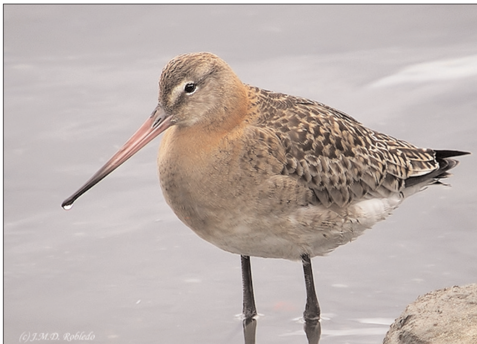
Aguja colinegra.

La Marisma de Solija de Santoña es el área más importante para el descanso de esta especie dentro del Parque Natural, compartiendo marisma con archibeques claros y comunes, ardeidas, cormoranes y espátulas. Una contradicción si vemos que también en la marisma más alterada, exceso de plantas invasoras ( Baccharis halimifolia y Cortaderia selloana ), aguas excesivamente eutrofizadas, así como la presencia cercana de la carretera y del paseo peatonal.