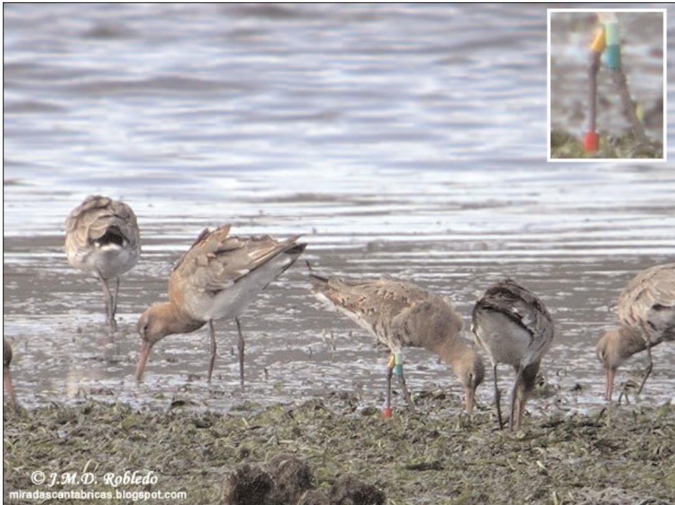
Aguja colinegra.

muy valiosa de sus movimientos migratorios, muy importantes para la conservación de la especie.