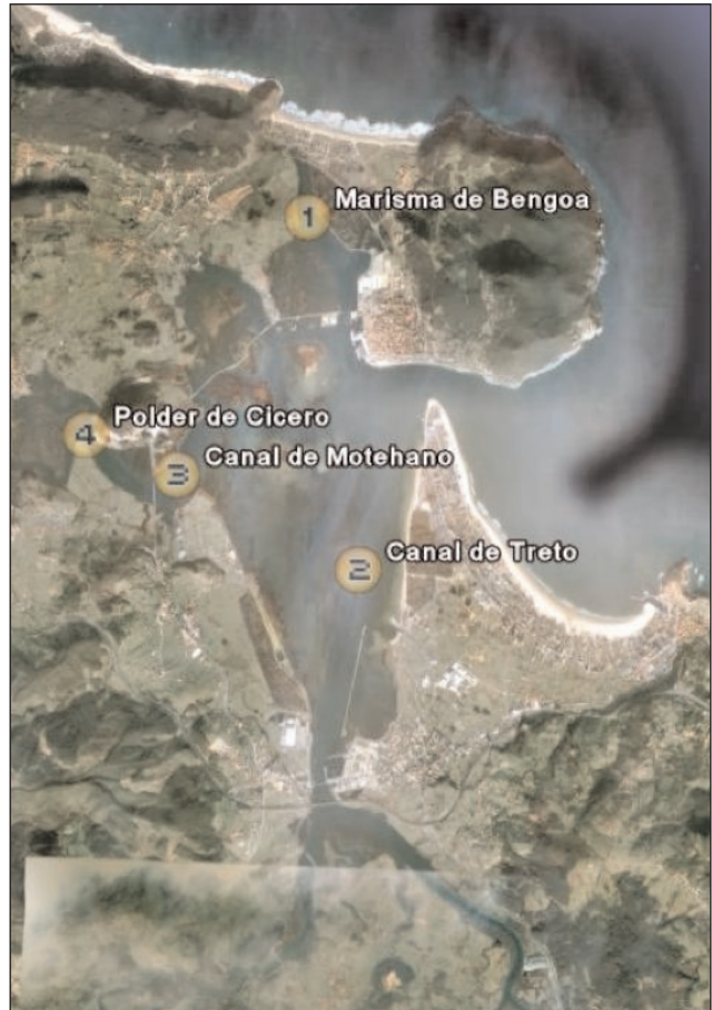
Mapa 1 / Map nº 1. Important aspects of the Black-tailed Godwit's feeding habits

Otra zona que de manera complementaria es utilizada es la de praderas inundadas, tanto el polder de la Marquesa o Cicero (4), un lugar idóneo para la alimentación de estas aves durante el invierno (Ver Mapa 1).