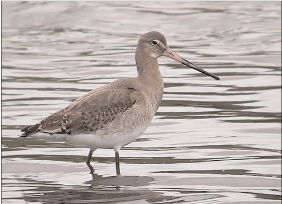
Aguja colinegra.

Con una longitud de 40 cm., se caracteriza por tener un pico recto y comprimido, de unos 11 cm., color amarillo o carne, con la punta de color negra. Así como las patas largas y negras, especialmente diseñadas para vadear aguas someras. En vuelo son inconfundibles las áreas blancas en el obispillo, que contrasta con una barra negra en el extremo de la cola. Una franja blanca alar, perceptible en vuelo. El plumaje del dorso es castaño ferruginoso, con la parte ventral blanca. En invierno es gris parduzco, cuello y pecho teñidos de ocre canela de intensidad variable.