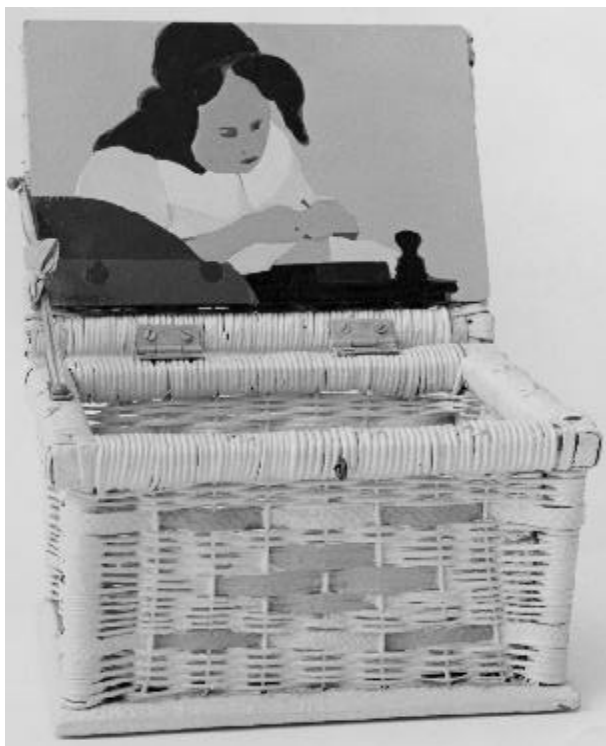
Beatriz González (Colombia, 1938) Encajera in situ, 20 x 25 x 40 cm, esmalte sobre lámina de metal, 1973.

Estudios sobre acciones exitosas por parte de las mujeres revelan que su organización en instituciones estables e independientes es crucial. Dichas instituciones, u organizaciones no gubernamentales (ONG), han examinado los diversos procesos sociales, económicos y culturales que reproducen formas existentes de opresión de género y han, por tanto, visualizado formas de crear un contexto para las luchas transformativas e identificado múltiples estrategias para lograr sus fines. Documentos del Banco Mundial plantean, por lo general, la necesidad de “construir instituciones políticas y sociales más abiertas” para permitir “un mayor compartir del agenciamiento, voz, y poder en la sociedad” entre los grupos subordinados, y sin embargo se abstienen de identificar organizaciones en los movimientos de mujeres.