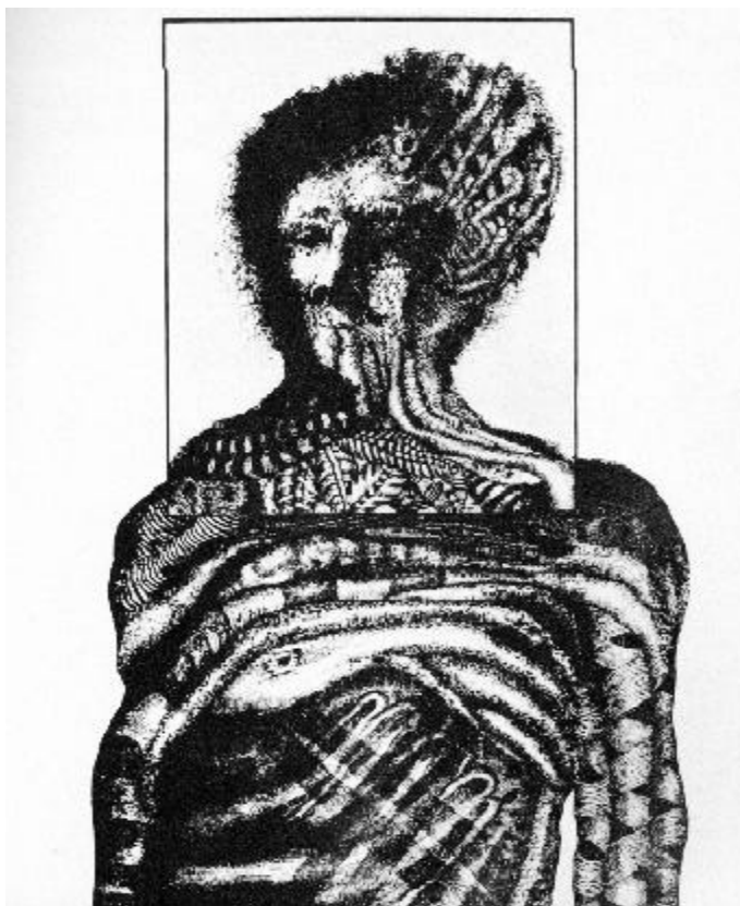
Pedro Alcántara (Colombia, 1942), Retrato de un guerrero, impresión planográfica, 1972

Los acuerdos internacionales actuales, como se ve en la iniciativa Educación para Todos, anunciada por primera vez en Jomtien (1999) y reiterada en Dakar (2000), sostienen la necesidad de asegurar el acceso educativo, aprendizaje y finalización exitosa de la escolaridad en los niveles de la primaria. Estos