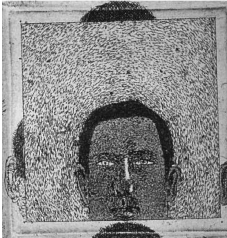
José Antonio Suárez, grabado

inequidades económicas y sociales que enfrentan las mujeres, en especial las mujeres pobres, es muy diferente de aquel que sirve para atacar la permisividad de las normas de la heteronormatividad. Las estrategias para la acción, además, dependerán de la resolución eventual de la definición de género.