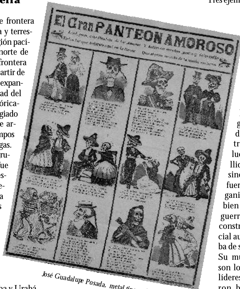
José Guadalupe Posada, metal tipográfico