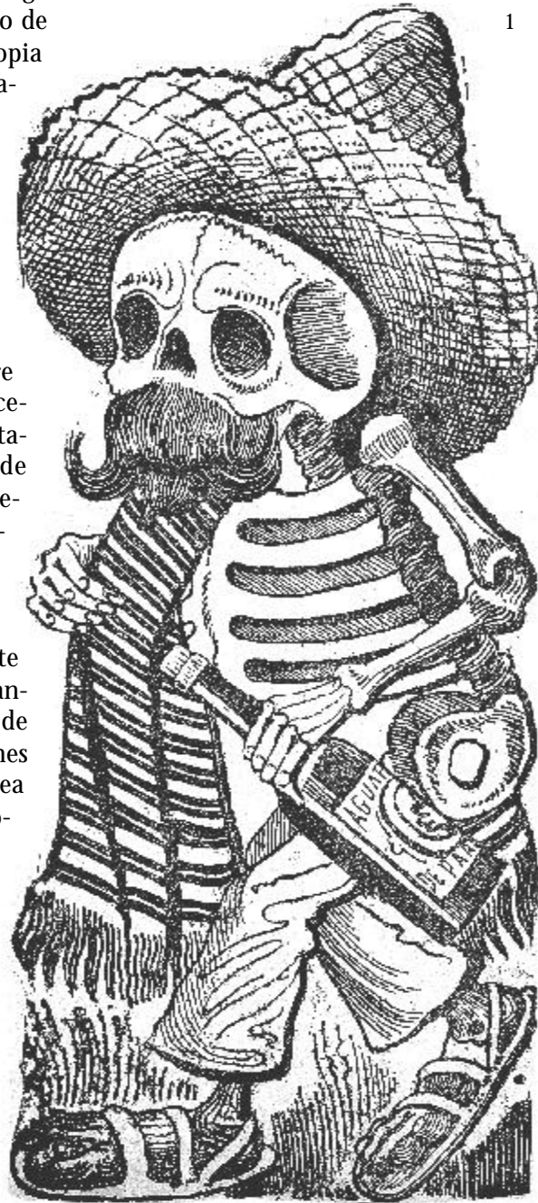
José Guadalupe Posada, grabado

El Laboratorio de Paz del Oriente Antioqueño juega a todas luces como escenario en donde se disputan distintos poderes; y si en el centro de esa disputa está la paz y la construcción de una región autónoma, también se dirime la