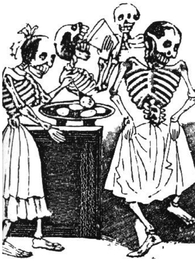
José Guadalupe Posada, grabado

Entendemos por “acción colectiva” el concepto más genérico que da cuenta de las acciones llevadas a cabo por un conjunto de individuos o de grupos en busca de un fin común 3 . Preferimos el uso de este término para referirnos a las acciones aquí analizadas, y no el de movimiento social, por el carácter puntual y sui generis que tuvo el caso analizado en el Urabá de mediados de la década del noventa y por el carácter “mixto” que adquirió, después de una primera etapa, la acción colectiva de resistencia a los efectos de la guerra en el Oriente antioqueño, esto es, por la conjunción de fuerzas de la sociedad ci-