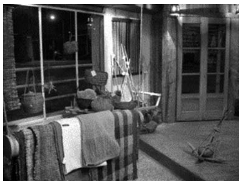
Foto: Almacén de la Biodiversidad, Chiloé – Chile, de Carlos Venegas

Del lado de la demanda se observa que las personas dejan de consumir commodities para consumir “productos” (Reardon y Timmer, 2005). Este nuevo comportamiento de los consumidores permitiría sustentar la producción de bienes o servicios con identidad territorial. Ejemplos de este cambio se observan en diferentes regiones y mercados. El creciente desarrollo de mercados orgánicos, comercio justo, turismo étnico o de aventura, etc., son una muestra del cambio en la canasta de productos y servicios de los consumidores.