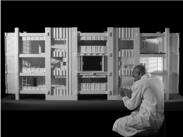
Sección constructiva de dos apartamentos de la Unité de Marsella a escala 1/10.