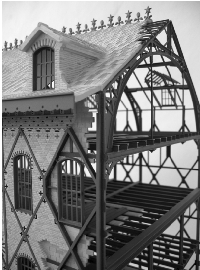
Musée National de Monuments Français. Citée de l'architecture, Paris, 2006. Imágenes archivo taller ETSAV.