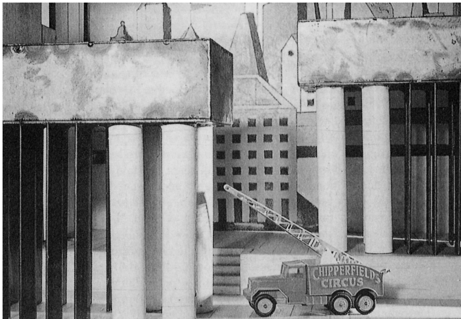
Maqueta Teatrino Scientifico (1978); detalle decorados de la maqueta interior del punto discontinuo del edificio del barrio milanés de la Gallarate.