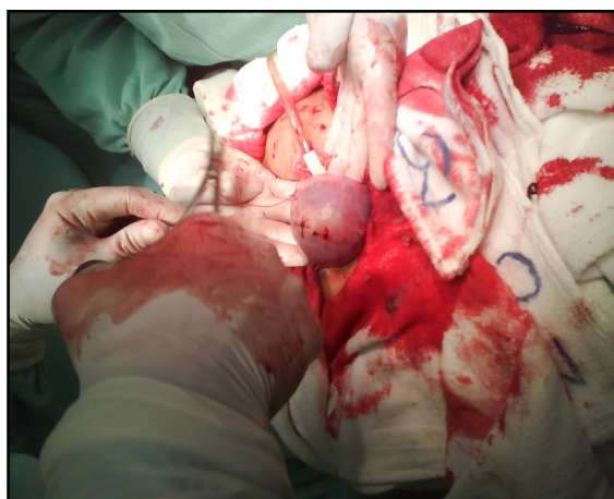
Figura 4 : Sutura invaginante para evitar la ruptura uterina en embarazos posteriores y las adherencias.

tenemos la frecuencia cardíaca de la paciente era 124 por minuto y su presión sistólica de 80mmHg, sería: 124/80 = 1.5