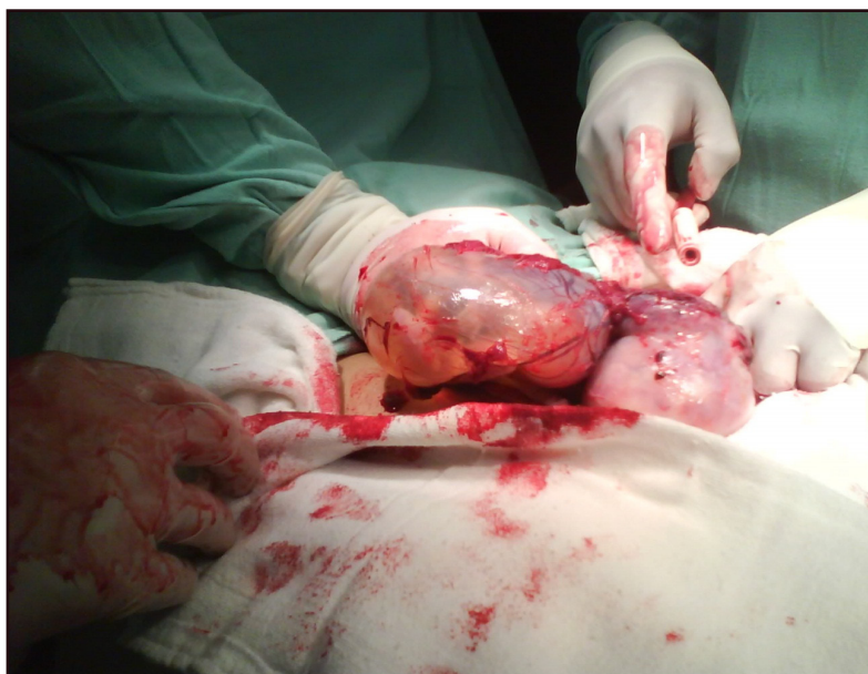
Figura 2 : Hallazgo de saco gestacional con membranas corioamnióticas en región cornual izquierda tras la laparotomía

En la enfermedad pélvica inflamatoria hay fiebre (>38.3°C), dolor pélvico abdominal, dolor a la palpación del útero, secreción vaginal mucopurulenta, velocidad de sedimentación globular elevada, presen-