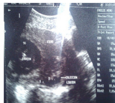
Figura 1: Ecografía de la paciente realizada en el Hospital Materno Infantil "Germán Urquidí", se observa presencia de líquido libre en el abdomen.

Entre sus antecedentes, la paciente tiene 4 embarazos previos, de los cuales tuvo 2 abortos y 1 ectópico. No utiliza ningún método anticonceptivo. No presenta más antecedentes relevantes. La paciente se encontraba en regular estado general, con presión arterial de 80/50mmHg, frecuencia cardíaca de 128 por minuto y frecuencia respiratoria de 26 por minuto. Presentaba mucosas pálidas y secas, a la exploración abdominal se evidenció aumento de volumen, dolor a la palpación profunda en hipogastrio Blumberg (+) y resistencia abdominal a la palpación profunda. En la evaluación del tacto vaginal presentaba vagina de paredes elásticas, cérvix posterior cerrado, Douglas