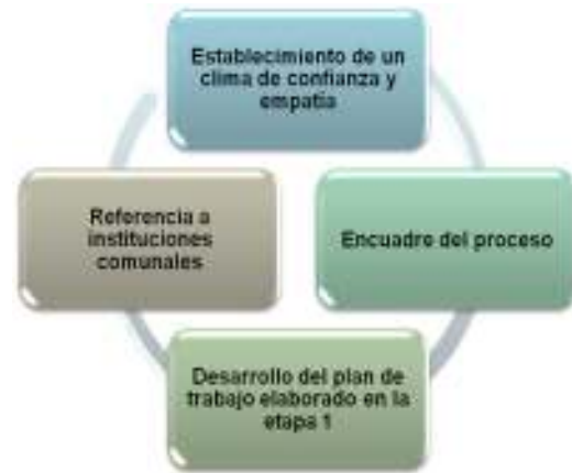
Gráfico N° 4: Ejecución del plan de trabajo

Los elementos de esta etapa se presentan en el siguiente gráfico: