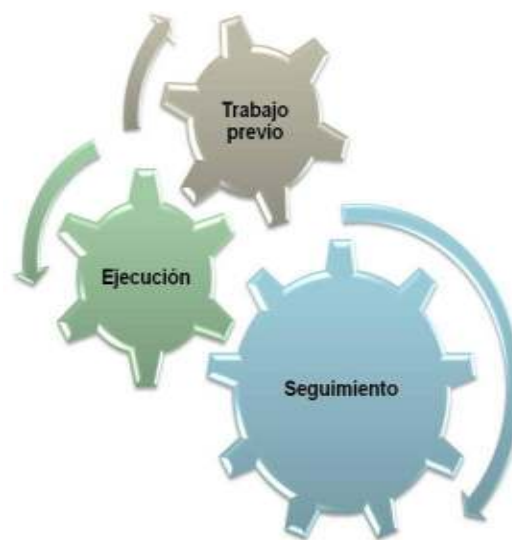
Gráfico N° 2: Etapas del proceso de intervención en Orientación

La propuesta de intervención se divide en tres etapas, las cuales son presentadas por el siguiente gráfico: