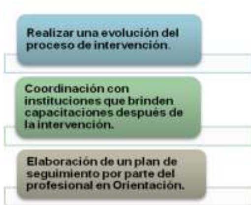
Gráfico N° 5: Seguimiento