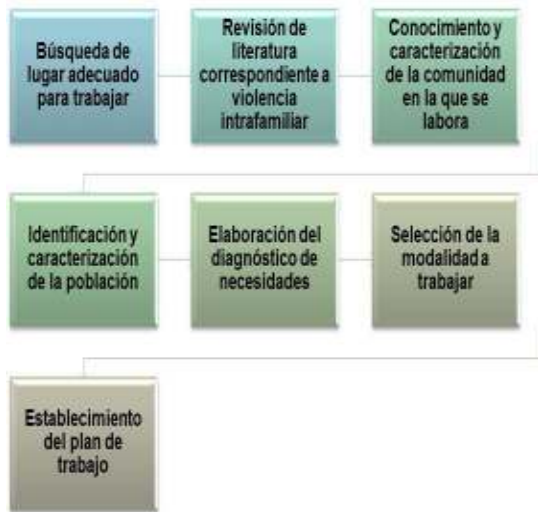
Gráfico N° 3: Trabajo previo a la intervención