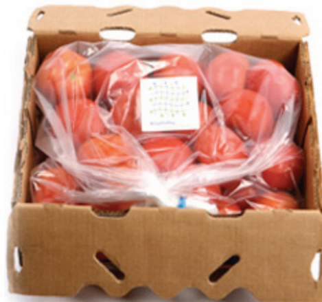
Figura 2. Aplicación de empaque con atmósferas modificadas para la conservación del tomate completo (Bestpackaging, 2010).

Las atmósferas controladas se han utilizado también para la conservación de los tomates, principalmente en estado verde, previniendo el ataque de bacterias como Salmonella enteritidis (Das et al. , 2006). Otro de los métodos de conservación de los tomates es la aplicación de cubiertas comestibles. Dichas cubiertas se definen como capas finas de cera u otro material que se