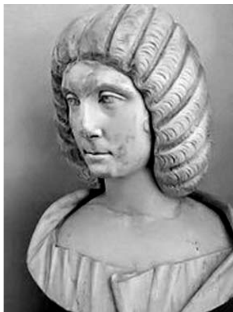
Imagen de mujer romana de inicios del siglo III.

La inclinación de las mujeres hacia el cristianismo inicial ha sido un tema de atención prioritario en la historiografía y la teología feministas 5 , pero es sobre todo la conversión de las más poderosas económica y socialmente, la que nos permite conectar con la posibilidad del patronazgo, como analiza Shelly Matthews 6 , y la continuidad, por tanto, de acuerdo a los nuevos pa-