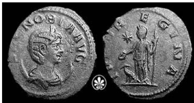
Monedas de Zenobia, reina de Palmira (Siria).

años, consiguió eludir los planes matrimoniales que había hecho para ella el emperador, y fue ordenada diaconisa por Nectario en la década de los noventa del siglo IV d.e. ( V. Olymp. , 3-6). Dicho vínculo con el obispo de Constantinopla lo mantuvo con su sucesor, Juan Crisóstomo, incluso después de su exilio, ayudándole con dinero para él y su séquito, y para auxiliar a los cautivos y los pobres ( V. Olymp. , 5; 7-8; 14).