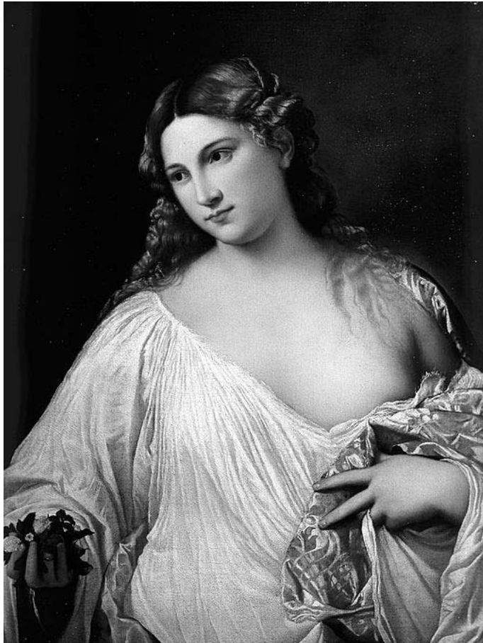
Fig. 5. Tiziano. Flora . 1515-1520.