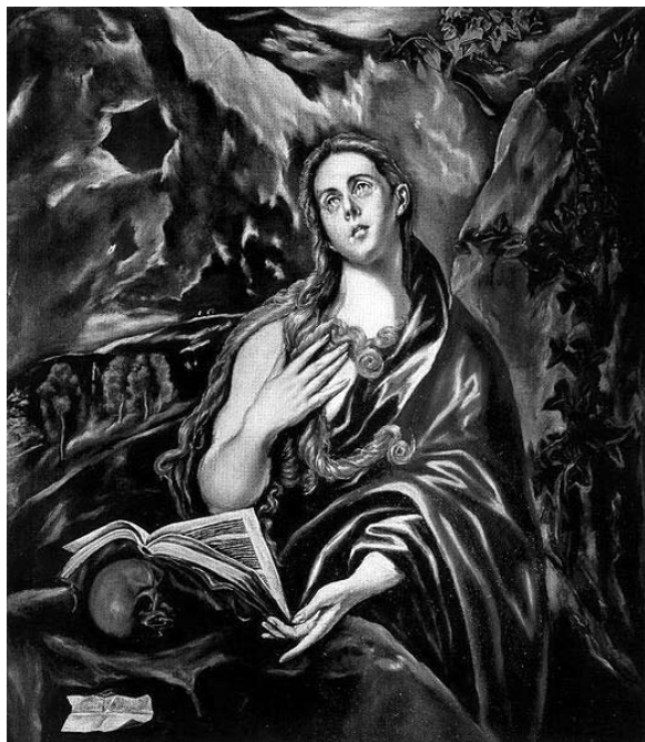
Fig. 4. El Greco. Magdalena penitente . 1605-1610.