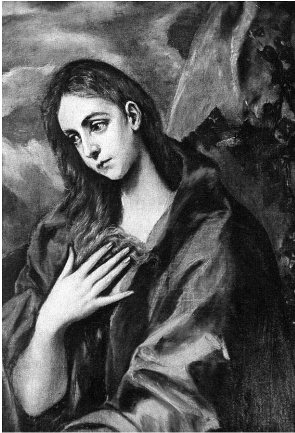
Fig. 3. El Greco. Magdalena penitente . 1585-90.

Si el arte barroco, como sostiene Orozco Díaz, era un arte “didáctico y seductor”, impulsado por el uso de ejemplos, ¿qué implica el hecho de que Zayas adopte una imagen tan didáctica y propagada como la “Magdalena penitente” y la engarce en su texto? No hay una sola manera de abordar esta pregunta: por un lado, si vemos el ékfrasis en Zayas como imitación, lo cual concordaría con uno de los caracteres definidores del arte barroco, se podría pensar que el propósito de Zayas es también pedagógico, y que en su obra reina un fuerte conservadurismo, deliberadamente funcional a la Contrarreforma. Por otra parte, debemos destacar que el ékfrasis, visto no meramente como técnica sino como estrategia discursiva, deja de ser una simple imitación. Ante la disyuntiva parece más productivo pensar en las técnicas textuales desplegadas por Zayas como estrategias discursivas. De este modo se hace posible indagar en aspectos posiblemente críticos de su obra.