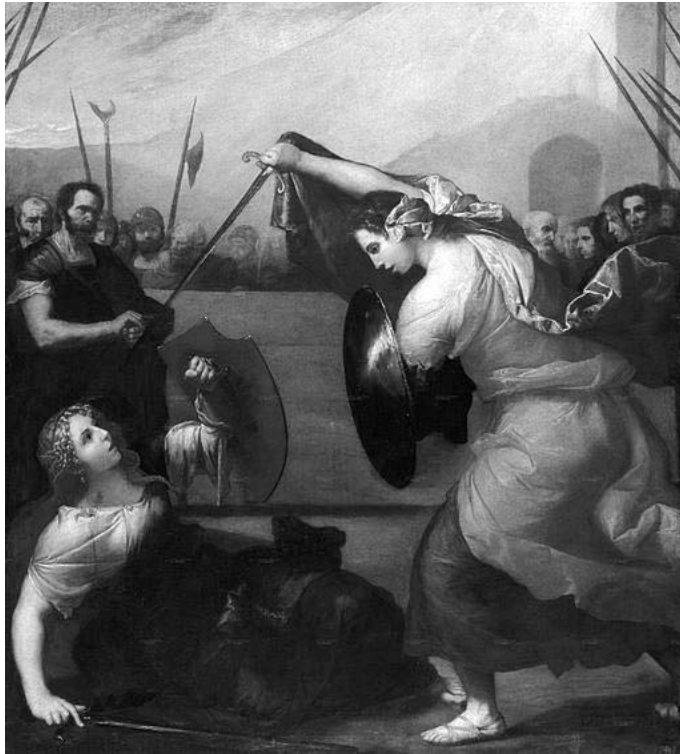
Fig. 1. José de Ribera. Combate de mujeres . 1636.

Gran Canaria. Allí son descubiertos por Don Jaime, quien los hospeda en su castillo. Apenas entra, Don Martín advierte que “el caballero debía ser muy principal y rico, porque todas las salas estaban aliñadas de ricas colgaduras y excelentes pinturas y otras cosas curiosas...” (236, mi énfasis). Rodeados desde un inicio por las excelentes pinturas de Don Jaime, los caballeros se sientan a la mesa a cenar. Es en ese momento que uno de los sirvientes abre una pequeña puerta, y los dos náufragos ven salir a una mujer, Elena,