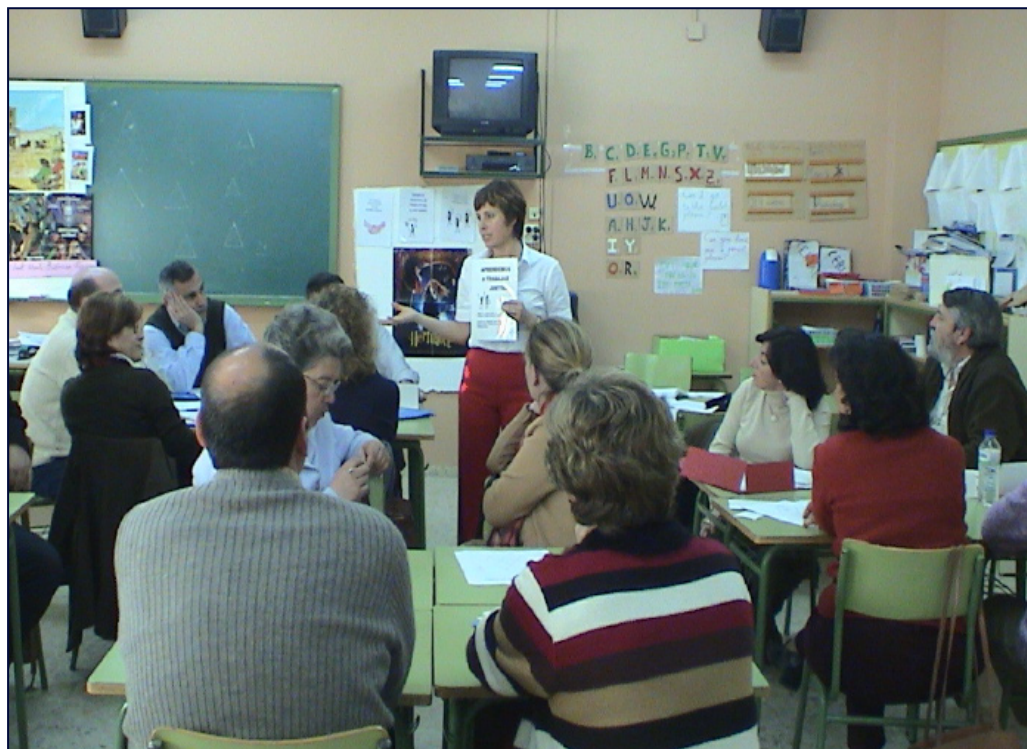
Foto 1. Sesión formativa impartida por teacher trainers a profesorado en España

• Profesorado . Esta figura ha sido la encargada en última instancia de desarrollar cada una de las actividades en las aulas. El número de profesores que recibió el primer año formación en materia de aprendizaje cooperativo y educación intercultural, fue un total de 22 profesores y profesoras, repartidos entre los cuatro colegios de las tres localidades onubenses Almonte, Bonares y Moguer. Sin embargo, el último año de proyecto, aun cuando el profesorado ha continuado recibiendo las unidades CLIM para ser realizadas en sus aulas, el número de profesores y profesoras