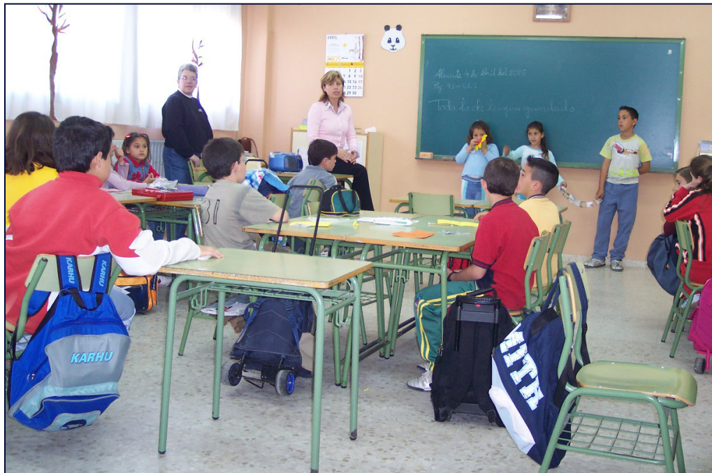
Foto 2: Desarrollo de la unidad 3 en un aula. Apoyo de teacher trainer dentro del aula

En este colegio la metodología de aprendizaje cooperativo y educación intercultural no ha sido una experiencia aislada y anecdótica en el tiempo, sino que ha calado en la planificación, organización e ideario del centro. Algunos datos que muestran esta situación han sido: