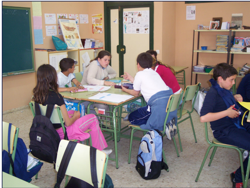
Foto 4. Alumnado trabajando de forma cooperativa