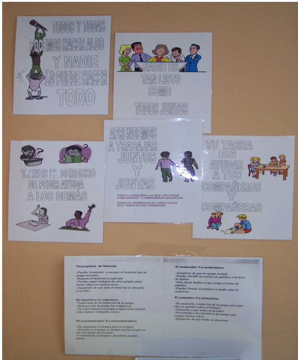
Foto 3. Los slogans elaborados por el alumnado en la pared de clase