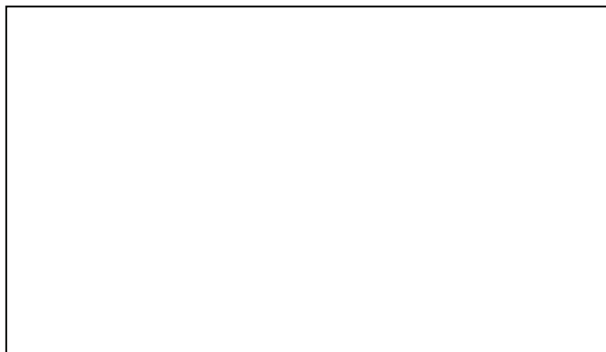
Figura 2. Diseño curricular del programa de formación

La exposición que se hace de los procedimientos didácticos está organizada de acuerdo con cada uno de los niveles del programa, la figura siguiente muestra este procedimiento.