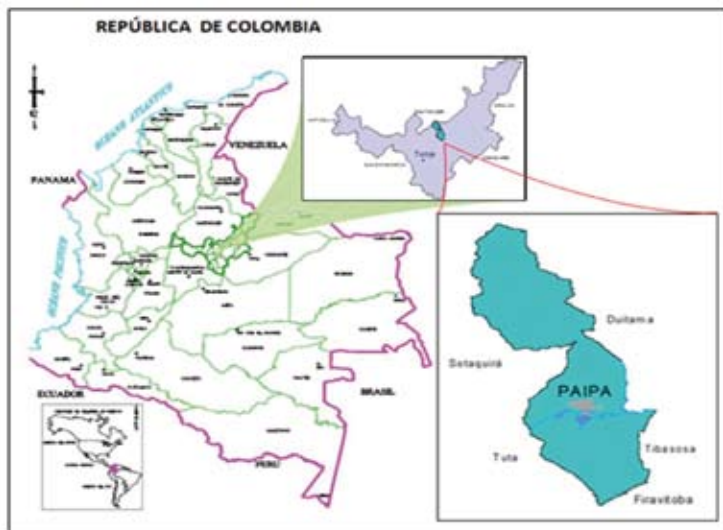
Figura 1. Localización de Paipa.