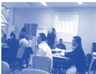
Figura 3. Sistema AAVAE.

Este modelo se está evaluando en un caso de prueba en la Escuela Superior de Cómputo del IPN mediante un sistema de acceso a servicios educativos aplicados a la enseñanza AAVAE (figura 3). El sistema cuenta con siete servicios: un blog móvil, un sistema de sesiones en línea para videoconferencia, un chat , foros, una biblioteca y servicio de archivos, cada servicio se puede encontrar distribuido en diferentes servidores.