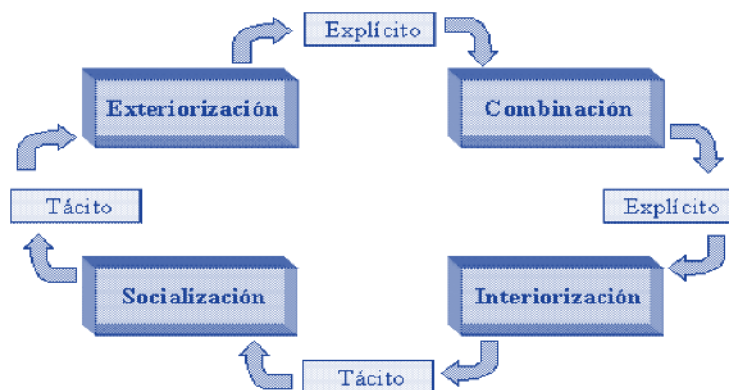
Figura 1. Procesos de conversión del conocimiento en la organización Nonaka y Takeuchi, 2009.

Usualmente el proceso requiere técnicas para capturar, organizar y almacenar el conocimiento donde se encuentre, para transformarlo en un activo intelectual que preste beneficios y se pueda compartir (Yang, B., Wang, H., Liang, L., Ma Quian., Chen, Ying and, Lei, Mui, 2007n, 2007).