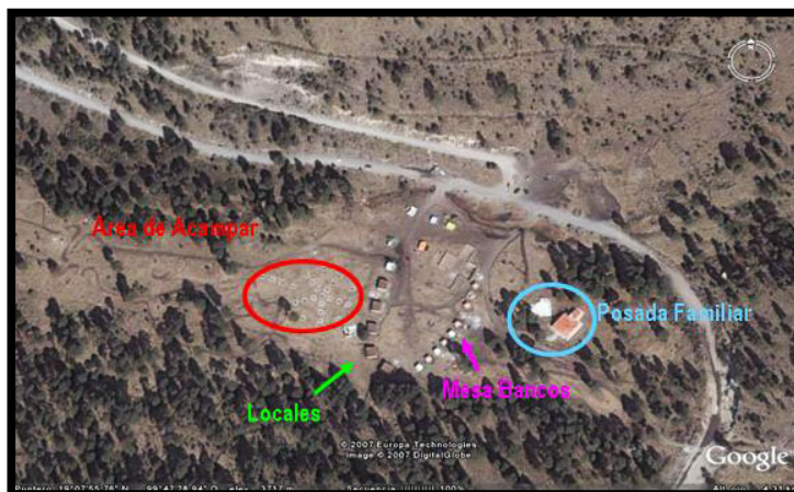
Figura 2. Distribución del Parque de los Venados.