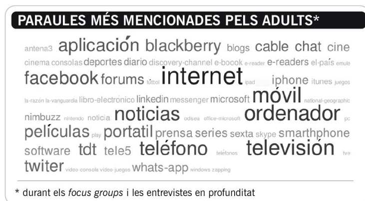
Taula 5. Paraules més mencionades pels adults i per les adultes

Sobre nous mitjans, destaquen l'ús de l'ordinador amb accés a internet i el telèfon mòbil. Del primer, elles usen el servei de veu per IP (Skype), les xarxes socials (Facebook), la missatgeria instantània (Messenger) i jocs online/offline , i ells consulten blocs i fòrums sobre viatges. Tots dos subratllen els perills per als més joves i les possibles estafes per la xarxa.