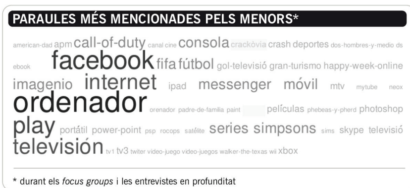
Taula 3. Paraules més mencionades pels nens i per les nenes

Usen les xarxes socials, d'una banda, perquè substitueixen les trucades telefòniques tradicionals: serveixen per quedar amb els amics, per tafanejar en els perfils en línia i per recuperar amistats (elles). I, de l'altra, en destaquen la versatilitat, la possibilitat de planificar esdeveniments, d'estar en contacte amb els amics i de "perdre el temps". Elles perceben que a Facebook hi són tots els seus amics i, per tant, és un lloc en el qual cal ser-hi. També elles fan la distinció de l'ús de la xarxa social LinkedIn amb finalitats professionals i són usuàries del xat i dels missatges instantanis en línia.