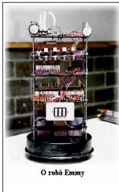
Figura 1 – Robô Móvel Autônomo Emmy – primeiro Robô com Controle Lógico Paraconsistente 1

Silva Filho (2007, pp.19-21), apresentam, por sua vez, um simulador de robôs com controle paraconsistente.