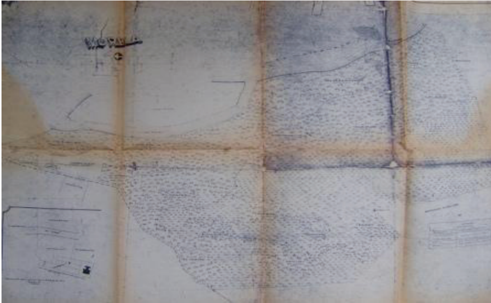
Figura 4. Plano Hacienda la Morela, s. f.