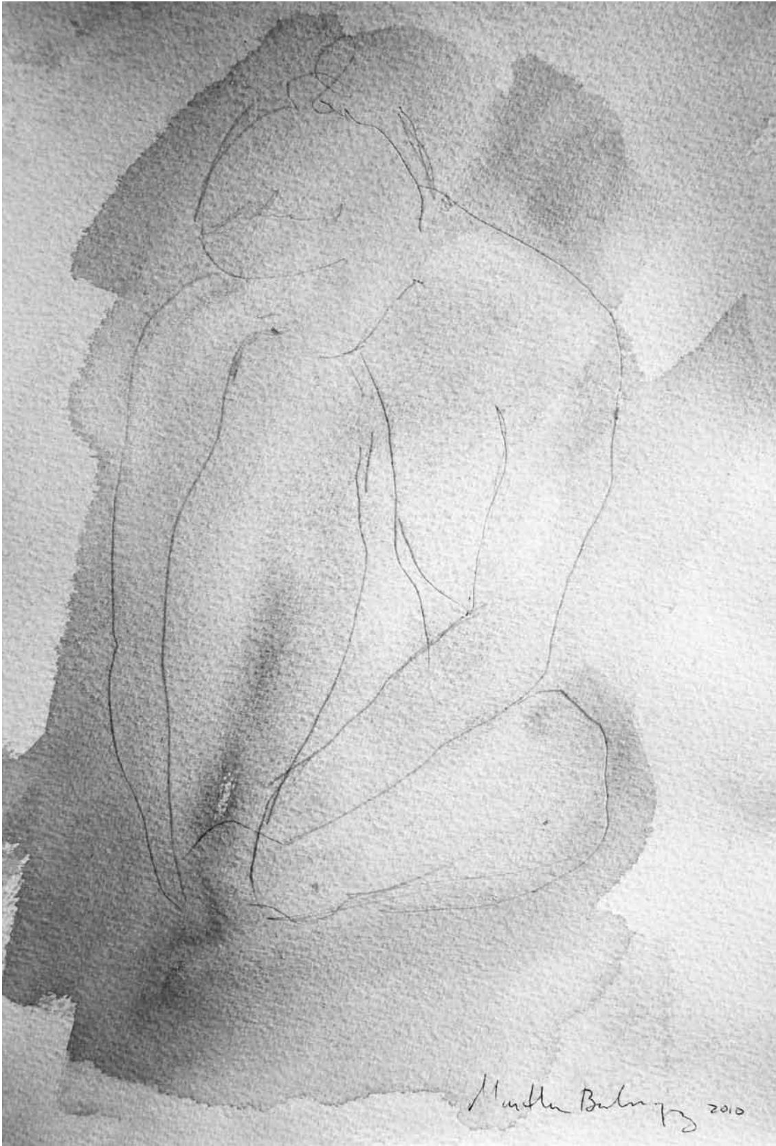
Sin título , dibujo serie Figura humana (pequeño formato), 2010 | MARTHA BOHÓRQUEZ