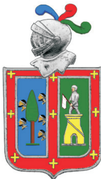
Armas de los Alonso de Celada

Existen y han existido en España varios cientos de apellidos compuestos. El que nos ocupa ahora, Alonso de Celada, es muy escaso y, como veremos, de origen burgalés. Aunque a primera vista parezca del primer tipo de apellidos compuestos que hemos mencionado -los que añaden el lugar de residencia, origen o señorío-, por las razones que veremos, en parte heráldicas, creemos que lo más probable es que refleje la unión de dos apellidos simples (Alonso y De Celada) y sus respectivos linajes, en origen