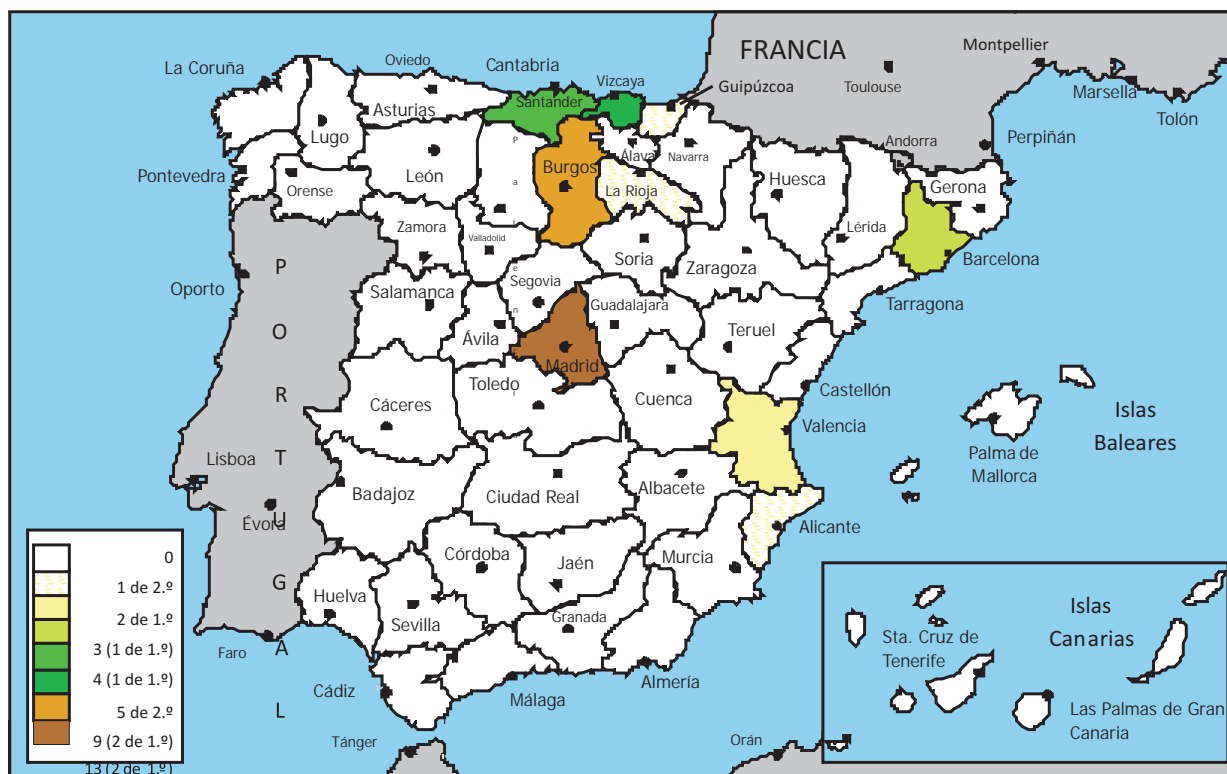
Distribución provincial de los aproximadamente 37 abonados de teléfono fijo apellidados Alonso de Celada (primer y segundo apellidos). España, hacia 2003.