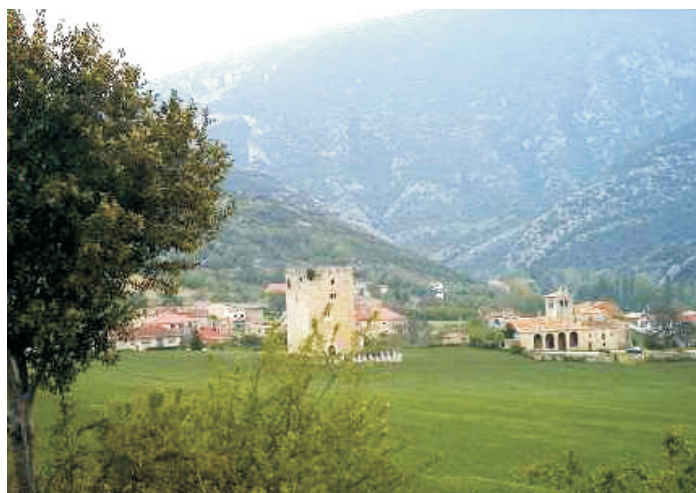
Valdenoceda (Merindad de Valdivielso). Torre de los Velasco e iglesia de San Miguel