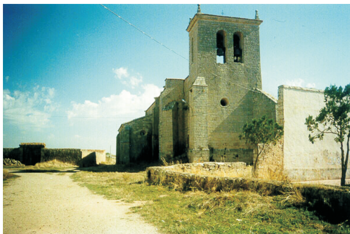
Iglesia de San Miguel de Celada del Camino (Burgos). Siglos XII-XVI

Celada. Pero ¿por qué formaron los Alonso de Celada su apellido con este complemento nominal? Una tradición familiar sobre el