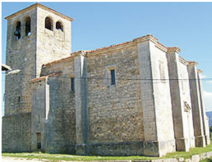
Iglesia gótico-renacentista de San Saturnino (Moneo). Siglo XVI

hidalgos acomodados tenían más medios y ocasión para aumentar su nobleza, y los comerciantes y labradores ricos que no la tuviesen, para lograr probarla, aunque fuese mediante testigos falsos. Es comprensible que tener o hacerse un apellido compuesto, como el de los Fernández de Velasco -condestables de Castilla cuya capital era Medina de Pomar-, fuera en Castilla un signo de nobleza que muchos hidalgos y aspirantes a hidalgos cuidaban de mostrar.