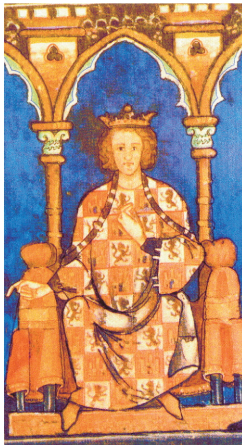
Alonso el Sabio de Castilla y León (1252-1284)

El antropónimo Alonso, de origen visigótico, fue tan popular -en parte por el prestigio del arzobispo de Toledo San Ildefonso, del siglo