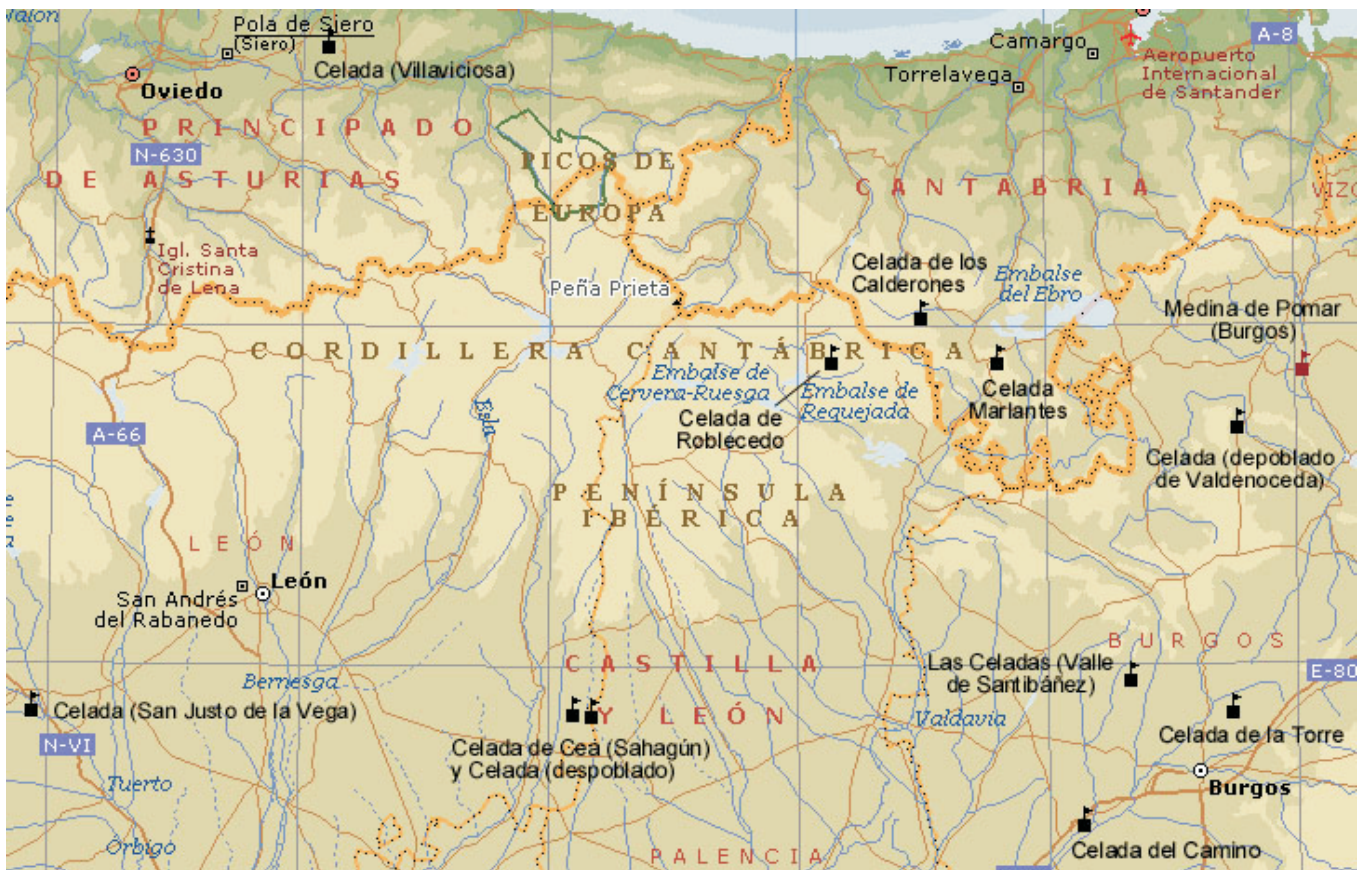
Poblaciones llamadas Celada en España: en Burgos, Cantabria, Palencia, León y Asturias

en la superioridad de su nobleza, ponen su origen en las luchas de la Reconquista de España (139) . Es posible que al principio el blasón trajera una sola cabeza y que, a causa de la progresiva complicación de las armas con el paso del tiempo, aumentara su número. Llama la atención que éste sea impar en las de Medina, lo que podría deberse a que las cabezas hubieran ocupado antes la partición de un blasón más apuntado, de forma más ojival, más antigua que la rectangular conopial.