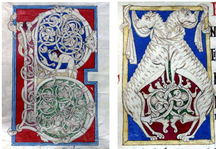
Figuras 6 e 7

A proliferação de animais nos manuscritos românicos portugueses expressa bem a sua importância, tal como demonstram os três Livros das Aves realizados nos três principais mosteiros que investiguei.