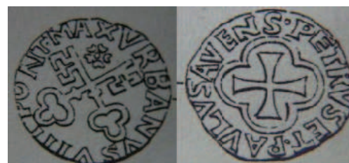
Patard du pape Urbain VIII (5)

Cette monnaie est censée imiter celles du comtat Venaissin voisin alors possession papale telle que reproduite ci-après :