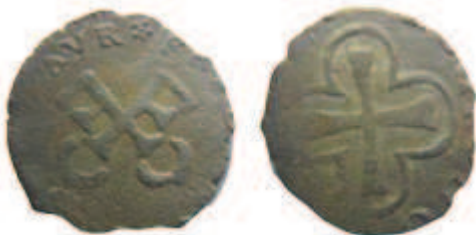
Cuivre 12-13 mm / 0,76 g