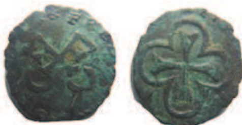
Cuivre 12-13 mm / 0,52 g

La monnaie ci-dessus semble être le patard d'Orange mal décrit, la grande différence se trouve à l'avers où deux grands F se croisent, à chacune de leurs bases se place un croissant, le croissant de droite ayant une légère protubérance en son milieu. Cette monnaie pouvait aisément être confondue avec celles émises par le pape Urbain VIII.