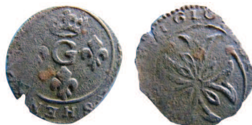
Billon 12-14 mm / 0,64 g

En triant un lot de monnaies je suis tombé sur un curieux liard au G :