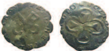
Cuivre 14 mm / 0,53 g

J'ai eu l'occasion d'étudier un lot de plusieurs centaines de monnaies du comtat Venaissin que j'ai dû nettoyer, parmi elles aucun patard d'Orange tel que décrit par les auteurs anciens n'a été retrouvé. En revanche, une monnaie d'un type très approchant l'a été :