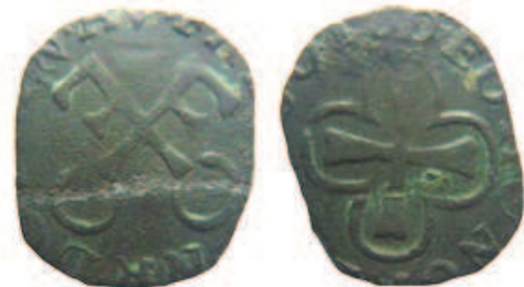
Cuivre 11-14 mm / 0,83 g

Une seconde monnaie a une typologie proche de la précédente :