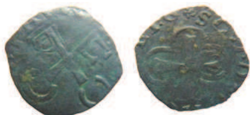
Cuivre 13 mm / 0,77 g

Une variante avec malheureusement des légendes très incomplètes :