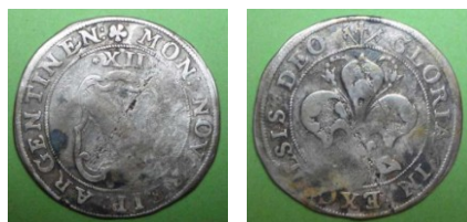
Num.1581 Ville de Strasbourg 1640-1658 12 Kreuzer (Dreibatzner) A/GLORIA IN EXCELSIS DEO R/MON NOV REIP ARGENTINEN

Exemple : la sélection de l'époque « Féodales » et la saisie dans la zone Description revers du mot clé « Strasbourg » fait apparaître à l'écran le résultat suivant :