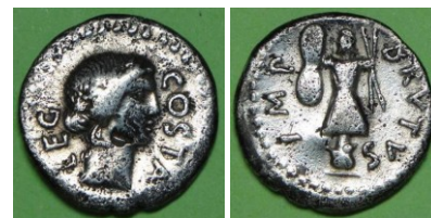
Num 1502 République romaine 42 av .J. -C. Denier A/COSTA LEG R/BRUTUS IMP

Exemple : la saisie des deux mots clés « romaine » et « Brutus » fait apparaître à l'écran le résultat suivant :