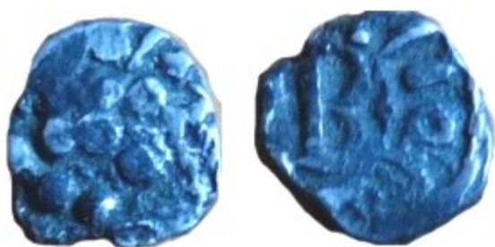
Figure 1 : Denier de Brioude

Il s'agit d'un denier provenant d'un atelier situé dans la région de la Haute-Loire : Brioude (Briuate Vico).