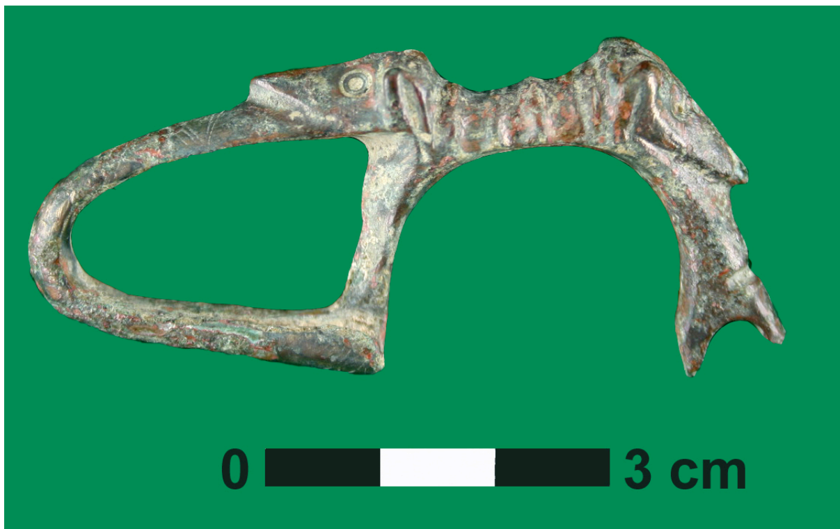
1. Fibula zoomorfa.