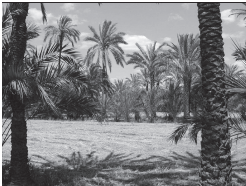
Foto 4. Huerto con identidad agrícola.