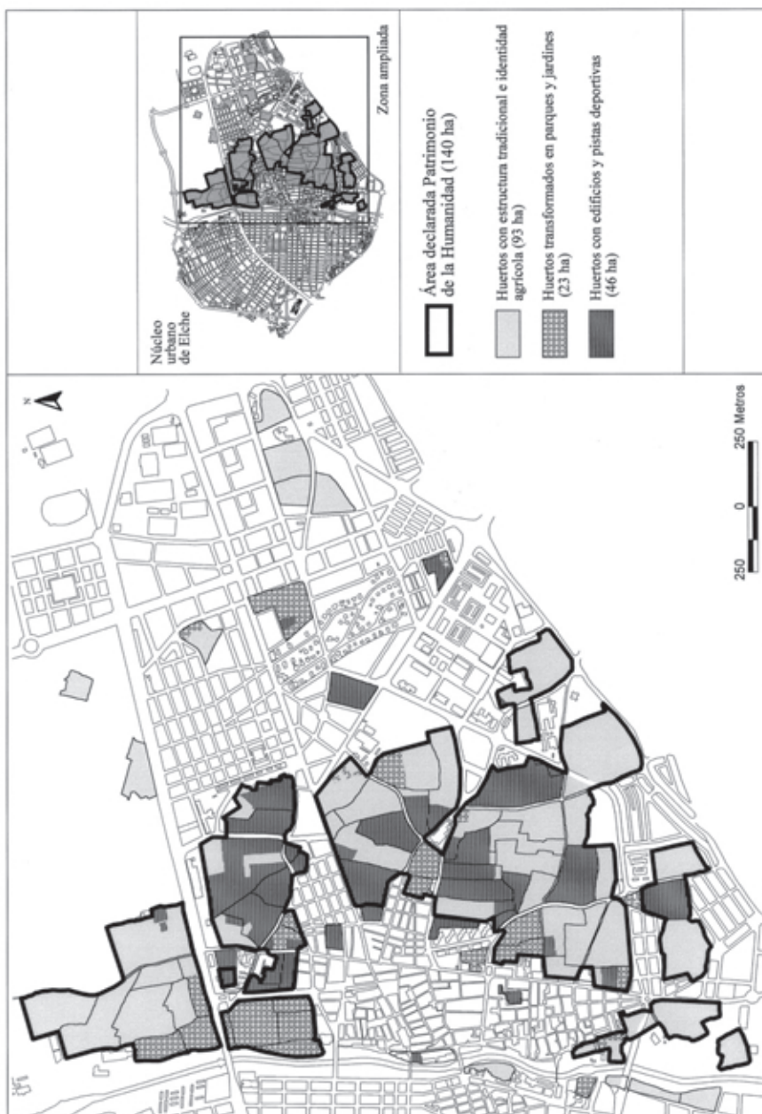
MAPA 2. Huertos de palmeras declarados Patrimonio de la Humanidad