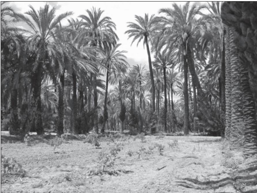
Foro 6. Huerto con identidad agrícola.