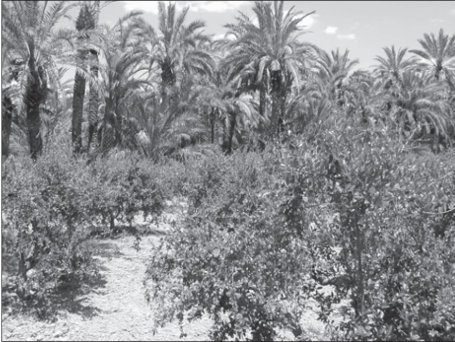
Foro 5. Huerto con identidad agrícola.