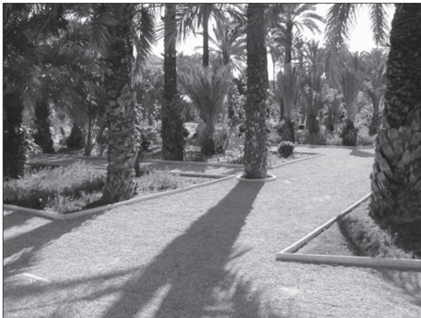
Foto 1. Huerto del Carmen (transformado en el Jardín Jaume I en el año 2000).