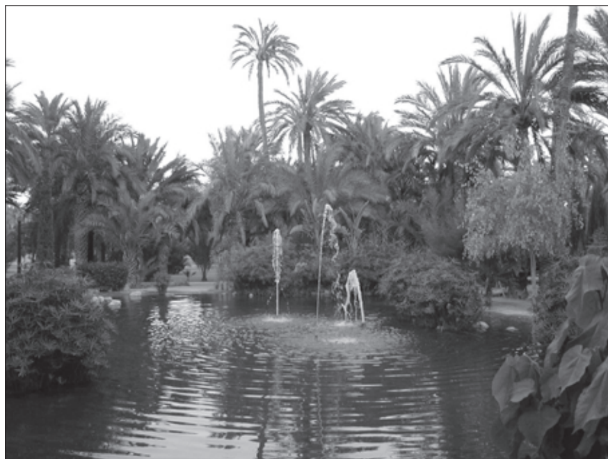
Foto 2. Huerto del Borreguet (transformado en el parque Filet de Fora en el año 1996).