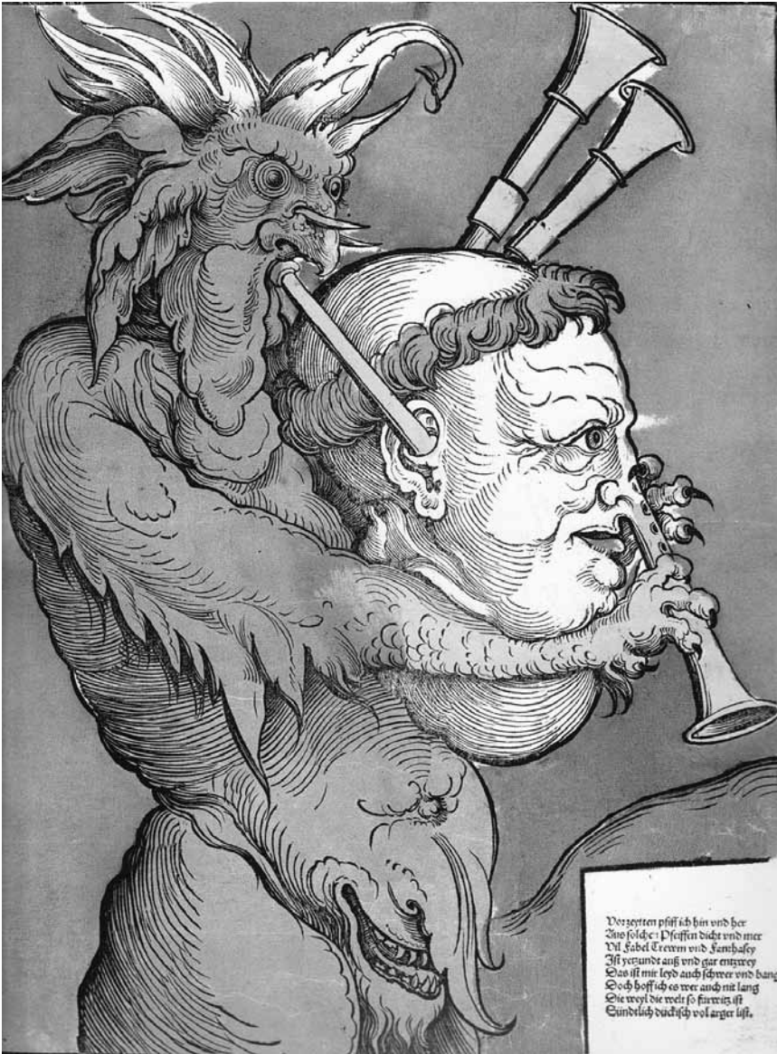
Xilografia El diable i la cornamusa (Erhard Schön, 1530)

Hi ha un tema que s'està fent recurrent els darrers anys i que és especialment rellevant per les conseqüències que té: amenaces, atemptats i un cost (sempre alt) en vides humanes. Com que fa temps que dura, ja se li ha donat un nom propi: "les caricatures de Mahoma".