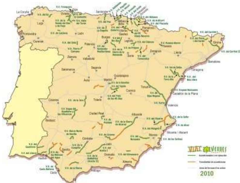
Figura. 1.- Mapa de vías verdes en España.

Una vía verde no sólo es seguir el trazado original de una vía ferroviaria, sino que se acompaña de servicios complementarios (restaurantes, puntos de información, museos, alojamientos,...) ubicados, normalmente, en las obras de fábricas que le son propias al sector ferroviario, hablamos de estaciones, apeaderos, muelles de carga, etc. Y, en los últimos años se observa la incorporación de elementos ferroviarios y/o industriales a modo ornamental o reutilizados como equipamientos, que nos recuerdan que tiempo atrás aquella construcción era una línea ferroviaria; participando en lo que se ha dado en denominar “ arqueología industrial ”, según Valero (1994, 294). Al mismo tiempo, se están añadiendo artworks (arte-escultura en la calle) con fines decorativos o con una función utilitaria, a fin de crear lo que Sustrans 5 denomina “the travelling landscape” (el paisaje del viajero).