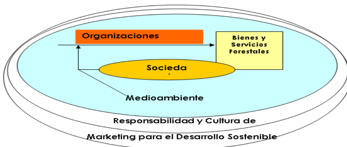
Figura. 1. Principio básico del marketing para el desarrollo sostenible.

“En la sociedad moderna, la producción y el consumo marchan por separado. El marketing los pone en contacto. Desde un punto de vista social, el marketing es una filosofía que muestra cómo crear sistemas eficaces de producción y, consiguientemente, cómo crear prosperidad. Los negocios son un subsistema de la sociedad, que cumple a la vez un papel económico y social. [Por lo tanto, una empresa debe operar de modo que haga posible producir beneficios para la sociedad y al mismo tiempo producir beneficios para la propia organización]. (Braidot, 1996)