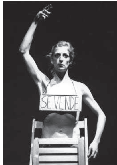
2. N. 14, 1997.

El humor impregna también esta serie y permite llevar a cabo un proceso de extrañamiento y disociación entre artista e intérprete que le conduce a comparar su cuerpo al de un pollo desplumado ( Sin título III ) o a arrastrar el cuerpo hasta la muerte, como en Manual de Uso (n. 20), una pieza tragicómica en la que el cuerpo se convierte en un aparato cuyas instrucciones de uso le conducen a la asfixia, o en N. 14 (n. 14) de carácter más violento. En esta última La Ribot se cuelga al cuello un cartel de cartón donde pone “Se Vende”, se encaja una silla de madera a la altura de la cintura y levanta un brazo en postura de ballet. Baja lentamente el brazo y de puntillas, mirando fijamente al público va caminando hacia atrás, se detiene y gira lentamente sobre sí misma hasta quedar de perfil y retroceder hasta el fondo de la sala donde dobla la silla contra su vientre de forma más violenta al tiempo que cae apoyada contra la pared hasta parar bruscamente y quedar tumbada y paralizada en el suelo 6 . Su fuerza plástica y performativa han convertido a esta pieza en uno de los iconos del proyecto.