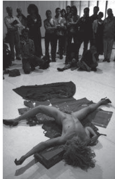
4. Another Bloody Mary , 2000.

“Por mi formación de bailarina intento ir a música, intento cortar el tomate y se me escapa. Se trata de encontrar una explicación diferente a la danza. Mi trabajo es un trabajo para la danza. Más que si es o no es, yo estoy para. Y en el vídeo se ven muchos detalles que cantan a bailarina, a bailarina de un-dos-tres, un-dos-tres... con el ajo de repente estoy siguiendo el ritmo y no lo hacía de manera consciente (...) me gusta mantener esa cosa que me hace ir a ritmo“. (La Ribot, 2003: 224).