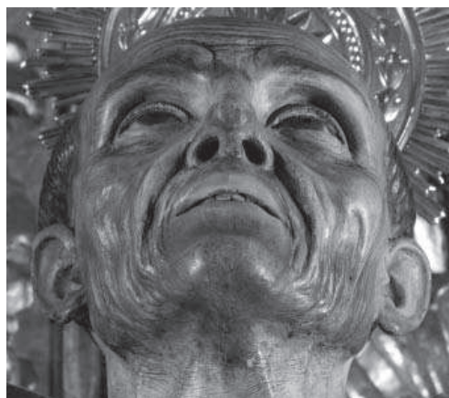
16. Pedro de Mena y taller (atribución). San Pedro Alcántara (detalle), ca. 1669-1678. Iglesia conventual de la Madre de Dios, Lucena.