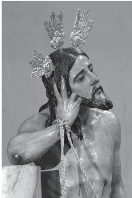
6. Pedro de Mena y taller (atribución). Jesús de la Humildad (detalle), ca. 1673-1676. Iglesia parroquial de Ntra. Sra. del Carmen, Lucena.