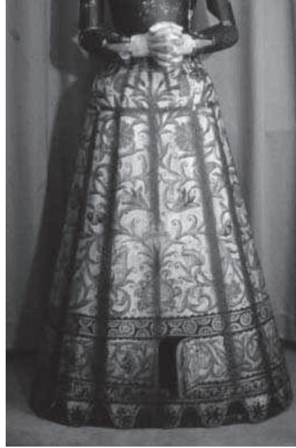
14. Círculo de Pedro de Mena (?) . Ntra. Sra. de los Dolores (detalle candelero), ca. 1677-1682. Iglesia parroquial de Ntra. Sra. del Carmen, Lucena.

de los Mártires de Málaga, pero ninguna está documentada. Resulta difícil aceptar que un escultor como Mena, en la cima del éxito profesional desde la década de 1660 y con un amplio taller a su cargo se dedicara a tallar personalmente imágenes de candelero. Parece más lógico que, a lo sumo, fueran realizadas bajo su atenta supervisión por oficiales del taller, sometidos a las directrices y últimos retoques del maestro, mientras que Mena se ocuparía personalmente de aquellas esculturas que por sus características o por la importancia del comitente así lo requirieran. De este modo, cabría vincular la Dolorosa del Carmen con algún obrador malagueño de hacia 1680 o, quizás, con la producción de algún anónimo oficial del taller de Mena, reinterpretando, a distancia, los patrones formales del maestro.