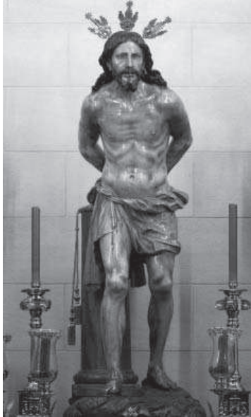
I. Pedro Roldán (escultura) y Bernabé Ximénez de Illescas (policromía). Cristo amarrado a la Columna, 1675. Iglesia parroquial de Santiago, Lucena.

la Veracruz vio incrementado notablemente su patrimonio debido a la munificencia de don Luis y a la mediación del pintor Bernabé Ximénez. En estas circunstancias, por ejemplo, fue adquirido a Pedro Roldán el célebre Cristo Amarrado a la Columna [1] por valor de 2.750 reales. La escultura, todo un alegato de la madurez del estilo de Roldán, del dominio del desnudo y de la asimilación del barroquismo de Arce, fue policromada por Bernabé Ximénez de Illescas por 1.200 reales 37 , lo que nos hace sospechar que pudo ser el intermediario entre don Luis y el taller de Roldán, habida cuenta de que uno de sus discípulos, el pintor malagueño Miguel Parrilla, aparecerá trabajando en numerosas ocasiones con Pedro Roldán 38 .