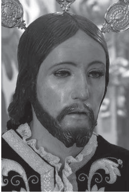
4. Pedro de Mena y taller (atribución). Sagrado Lavatorio, 1679 (detalle de Jesús). Ermita de Dios Padre, Lucena.

El Sagrado Lavatorio es ciertamente una iconografía poco frecuente, con más precedentes pictóricos que escultóricos, muy pocos en el caso de la escultura procesional. Sin embargo, su presencia se justifica en una cofradía como la de la Veracruz, quizás la más teatralizada de las cofradías pasionistas de Lucena, que sacaba en procesión pasos tan extraños como la Alegoría del Concilio de Trento o, a partir del XIX, la de la Santa Fe, y que explotaba el citado corral de comedias. El tema del Lavatorio está tomado del Evangelio de Juan (13, 1-20) y hace alusión al momento en que Cristo lavó los pies de sus apóstoles antes de la Cena. En Oriente era costumbre que los esclavos lavaran los pies de los invitados, de modo que con este gesto de servidumbre el Cristianismo reafirma la humildad de Cristo y justifica el bautismo de los apóstoles, previo a recibir la Sagrada Forma. Además el asunto contaba con referencias en el Antiguo Testamento (los tres ángeles