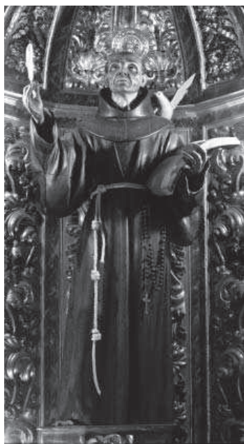
15. Pedro de Mena y taller (atribución). San Pedro Alcántara, ca. 1669-1678. Iglesia conventual de la Madre de Dios, Lucena.