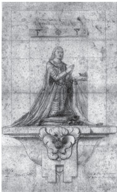
9. Pedro de Mena. Boceto de Fernando el Católico, ca. 1675. Col. Universidad de Leiden, Holanda.

temporal y subsanando algunas lagunas de los Evangelios. Por eso no es difícil entender que de un episodio como la Flagelación –con tanta difusión, por cierto, en una época en que proliferaban las procesiones de disciplinantes– surgieran algunas variantes iconográficas que inciden en el carácter macabro de la escena e intentan igualmente humanizar a Cristo, siempre con el fin de conmover los afectos del fiel. Es el caso del Cristo recogiendo sus vestiduras, con excelentes ejemplos pictóricos en la obra de Cano y Murillo. Igualmente nacieron otras iconografías como la del Cristo a la Columna asistido por ángeles o ésta que nos ocupa, que no es más que una hibridación entre el Cristo pensativo y flagelado, trasladando el momento de la meditación de Cristo al instante inmediato a la flagelación, justo antes de volver ante Pilatos.