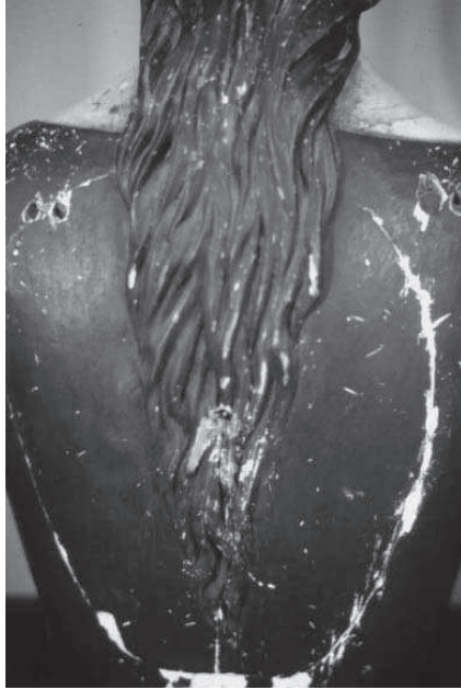
13. Círculo de Pedro de Mena (?) . Ntra. Sra. de los Dolores (detalle cabellera), ca. 1677-1682. Iglesia parroquial de Ntra. Sra. del Carmen, Lucena.