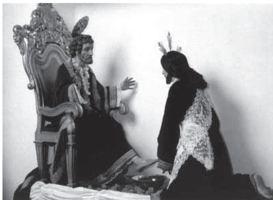
2. Pedro de Mena y taller (atribución). Sagrado Lavatorio, 1679. Ermita de Dios Padre, Lucena.

del cabildo. Precisamente son estas élites locales las que ejercían buena parte del mecenazgo artístico, pues además de alhajar sus palacios y oratorios, eran las responsables de la fundación de memorias, patronatos y capellanías en parroquias y conventos y, lo que más nos interesa para el caso, monopolizaban el gobierno de las hermandades y cofradías en un claro intento de afirmarse socialmente.