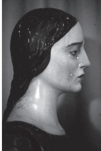
12. Círculo de Pedro de Mena (?). Ntra. Sra. de los Dolores (detalle), ca. 1677-1682. Iglesia parroquial de Ntra. Sra. del Carmen, Lucena.

las manos entrelazadas, para ser vestida, y que Cano difundió en Granada en su reproducción pictórica para una de las capillas de la catedral.