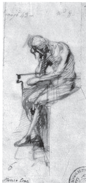
10. Anónimo. Cristo de la Humildad . Museo del Prado, Madrid.

El Cristo de la Humildad hace pareja con una Dolorosa zde vestir, la Virgen de los Dolores [11], que cabría fechar entre un cabildo de la hermandad de 1677 y otro de 1682, en que ya aparece citada 66 , ocupando ambos los retablos del crucero de la iglesia del convento San José de carmelitas descalzos 67 . La aparición del nombre de Pedro de Mena entre los documentos de la cofradía así como la fecha de ejecución de la imagen hicieron que en un primer momento se pusiera la imagen en relación con el escultor, fundamentalmente a raíz de los trabajos de conservación y restauración a los que fue sometida por Salvador Guzmán Moral, quien le devolvió su policromía original 68 . Esta atribución ha sido recogida por algunos autores no sin reservas 69 y de todo este corpus de imágenes es la que sin ninguna duda más problemas de vinculación al maestro plantea. La Dolorosa, una imagen de candelero con cabeza y manos de talla, recoge el tipo creado por Gaspar Becerra para los mínimos de Madrid, de Virgen doliente, con