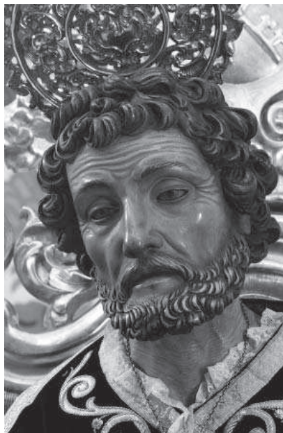
3. Pedro de Mena y taller (atribución). Sagrado Lavatorio, 1679 (detalle de San Pedro). Ermita de Dios Padre, Lucena.