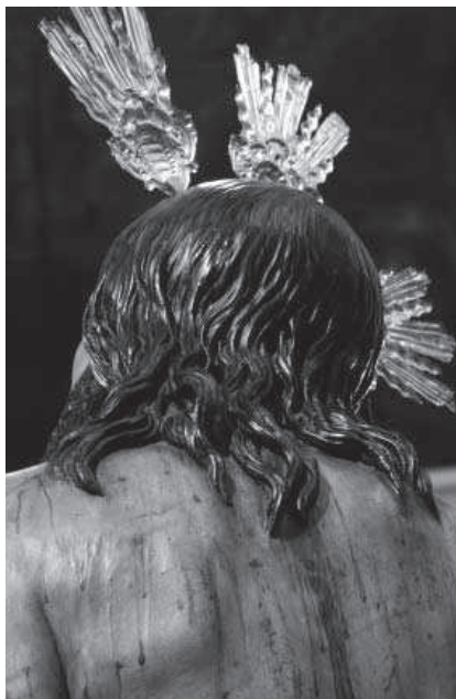
8. Pedro de Mena y taller (atribución). Jesús de la Humildad (detalle), ca. 1673-1676. Iglesia parroquial de Ntra. Sra. del Carmen, Lucena.