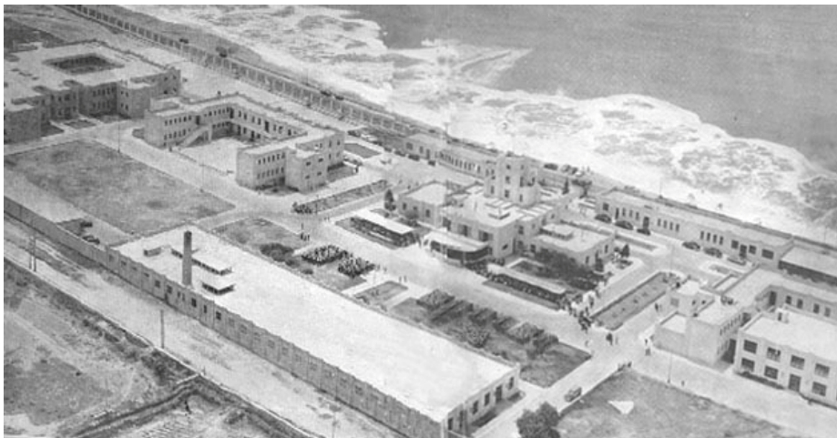
Figura 2. Vista aérea del colegio militar Leoncio Prado de los años 50. Nótese su extensión y relación con el mar.

Asimismo, el colegio presenta aquellas características a las que Foucault había aludido en referencia a los ambientes carcelarios: cerramiento, complejidad y jerarquía, se reproducen magistralmente para configurar el recinto educativo-militar. Éstos tienen su plasmación física en el muro como elemento indispensable de confinamiento, el urbanismo a breve escala y la imponente de los edificios de valor institucional. El resultado: una serie de espacios propedéuticos para la vida adulta, una ciudadela o "antesala" para la gran ciudad.