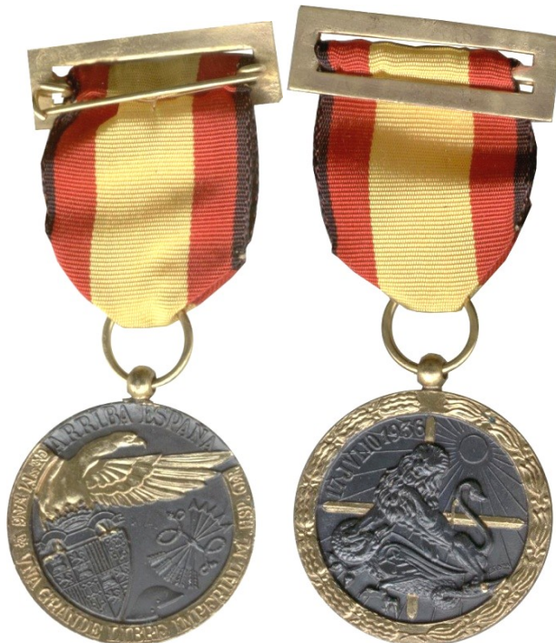
Vanguardia Tipo 6 - Colección particular