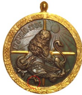
Tipo 4c - Colección de JMGC