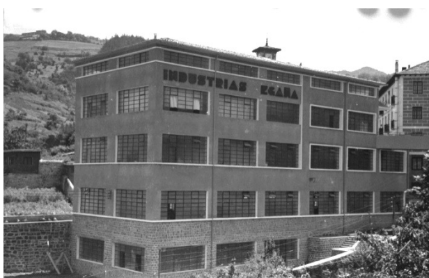
Empresa "Industrias Egaña" 1943 Signatura KUTXA_MACA_1_2716_2195_00019