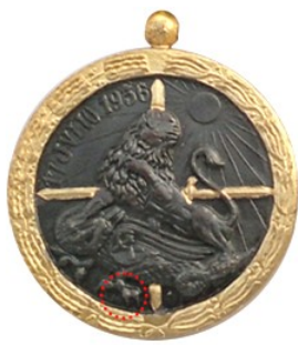
Tipo 4e - Colección de JABT