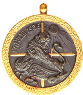
Tipo 4b - Colección de Johan Deville