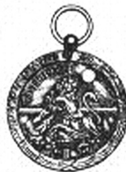
Spanische Feldzugs Medaille Nr. 12535 - J. 6.48