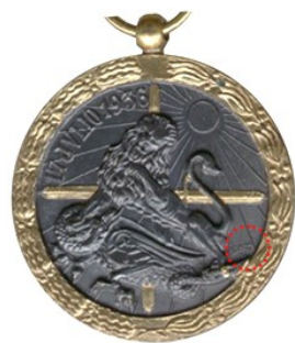
Tipo 6 - Colección particular