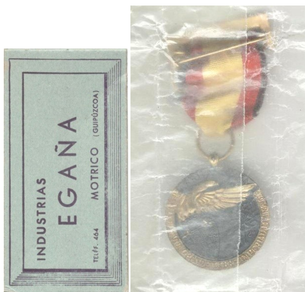
Caja original del modelo egaña y presentación en el papel engrasado