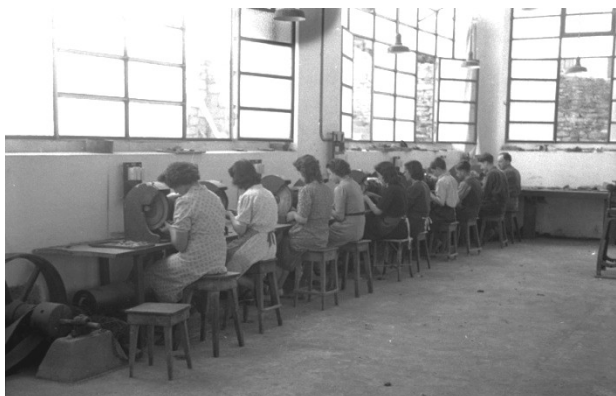
Empresa "Industrias Egaña" 1943 Signatura KUTXA_MACA_1_2716_2195_00003