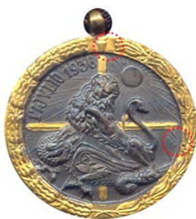
Tipo 1 - Colección particular