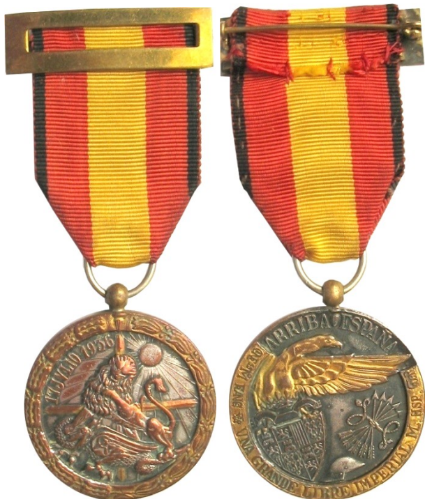
Vanguardia Tipo 1 - Colección particular