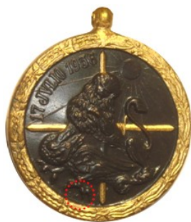
Tipo 4d