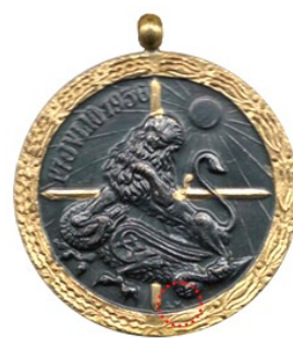
Tipo 8