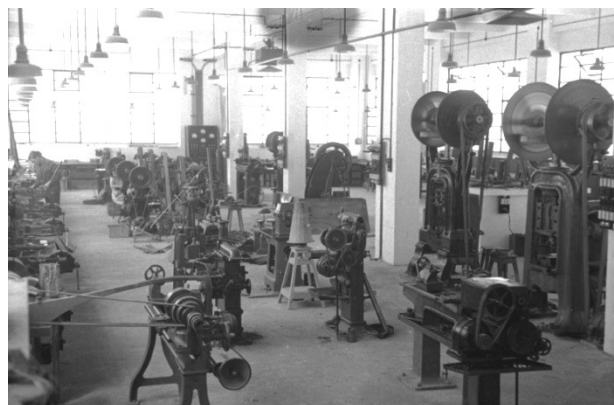
Empresa "Industrias Egaña" Fondo foto car. Vicente Martin Kutxa Fototeka 1943 Signatura KUTXA_MACA_1_2716_2195_00017