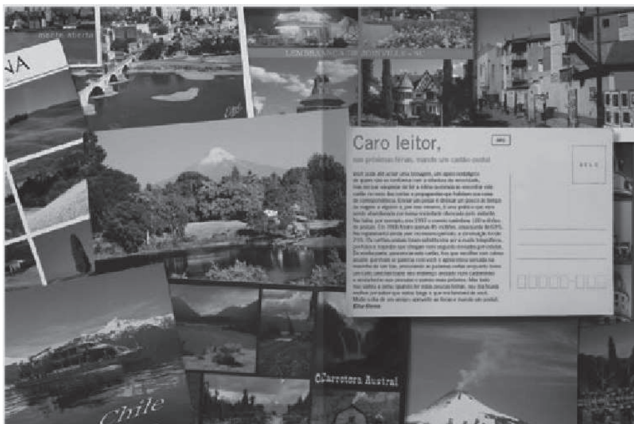
Imagen 10, 'Mente Abierta', en la edición 61 de 2007.