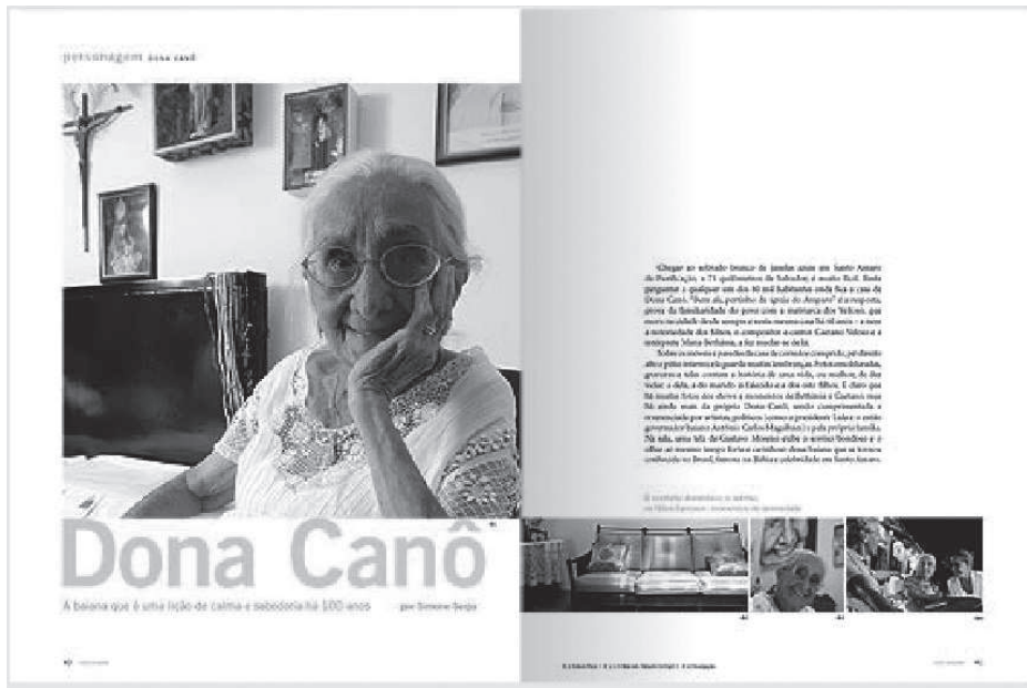
Imagem 7, 'Personaje', edición 61 de diciembre de 2007.