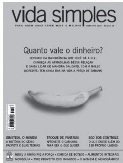
Imagem 4, fevereiro de 2005.