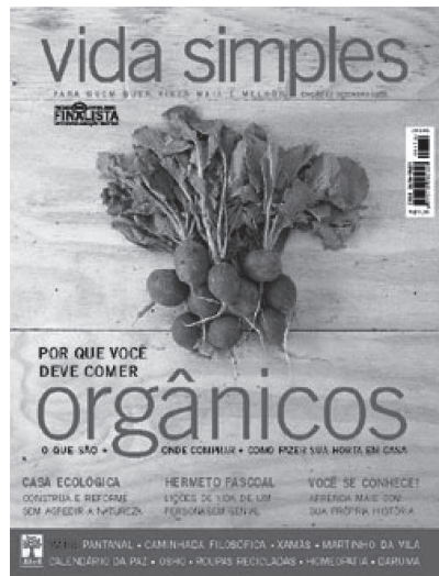
Imagem 3, dezembro de 2003.