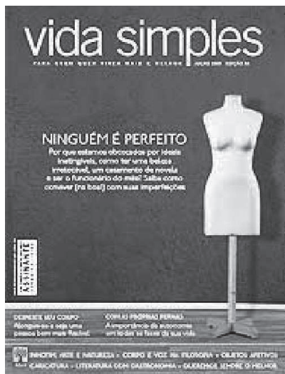
Imagem 5, julho de 2008.