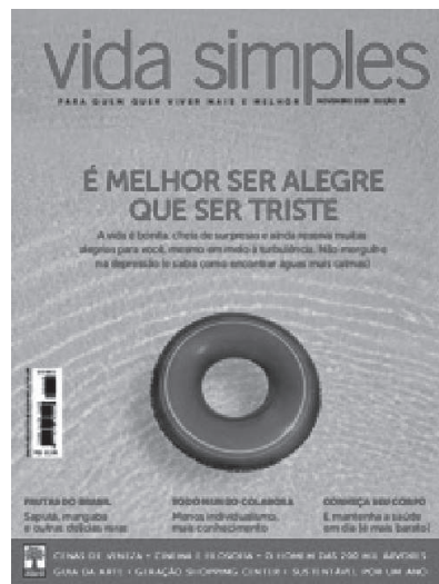
Imagem 6, novembro de 2009.