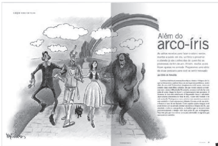
Imagem 9, reportaje principal en la edición 61 de diciembre de 2007.