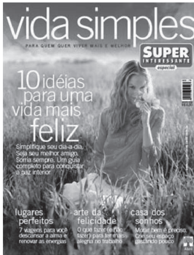
Imagem 1, agosto de 2002.