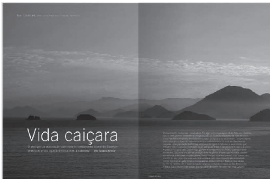
Imagen 11, 'Horizontes', en la edición 61 de diciembre de 2007.