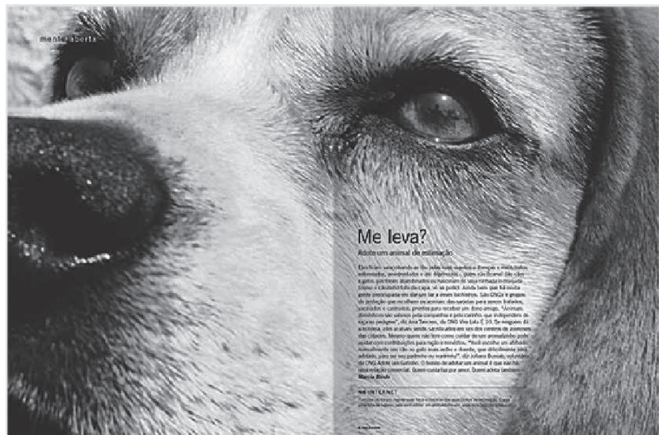
Imagem 8, 'Mente Abierta', edición 61 de diciembre de 2007.