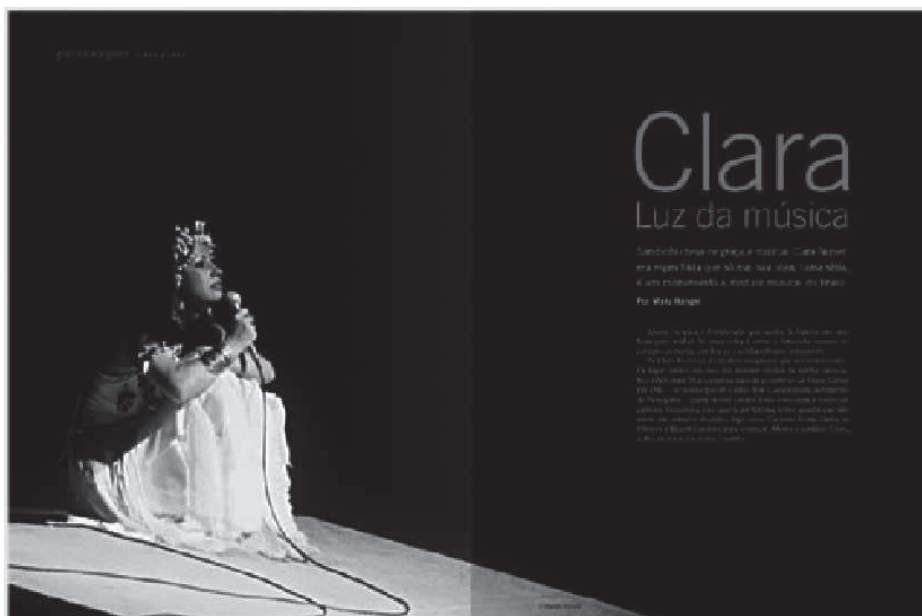
Imagen 12, otro 'Personaje' de la edición 61 de diciembre de 2007.