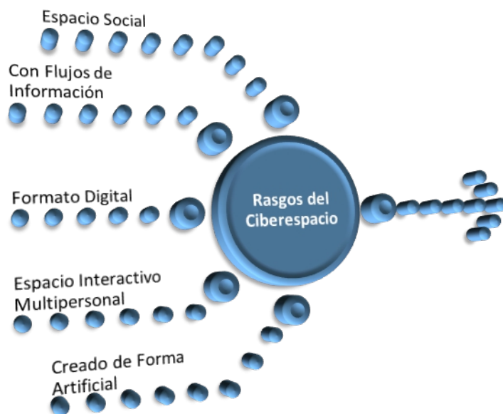
Figura 4. Elementos del Ciberespacio

La primera hace alusión al lugar donde se producen las interacciones que originan la formación de una cultura, allí se analiza el