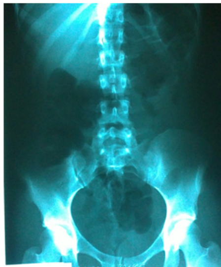
Figura. 1: Radiografía abdominal con colon transverso dilatado, abundante contenido fecal en cúpula rectal.

Los hallazgos relevantes a la exploración física de ingreso fueron: paciente en regular estado general consciente, orientada, afebril, mucosas húmedas, cardiopulmonar clínicamente normal, abdomen: simétrico, blando, depresible, doloroso a la palpación profunda en mesogastrio e hipogastrio, disminución del peristaltismo, sin alteración neurológica, sensibilidad y motilidad distal adecuada. En la interconsulta es valorada por servicio de medicina interna que según la clínica determina las siguientes impresiones diagnósticas: íleo adinámico e infección del tracto urinario (ITU). Se obtiene radiografía abdominal que reporta colon transverso dilatado y abundante contenido fecal en cúpula rectal (Fig.1). La paciente continuó con polaquiuria, pujo y tenesmo vesical, urgencia miccional, dolor en mesogastrio e hipogastrio que no cede con metamizol, se mantuvo diaforética y algida, por lo que se administra morfina. Se realiza tomografía axial computarizada (TAC) abdomino pélvica sin contraste debido a la falla renal, se observa imagen sugerente de cálculo ureteral razón por la que se solicita valoración por el servicio de urología, una nueva TAC contrastada mantiene imagen sugestiva de lito en unión uretero vesical, izquierda (Fig. 2). Por lo que se realiza ureteroscopia diagnóstica con resultados normales. Al día siguiente la paciente presenta nuevamente episodio de dolor intenso